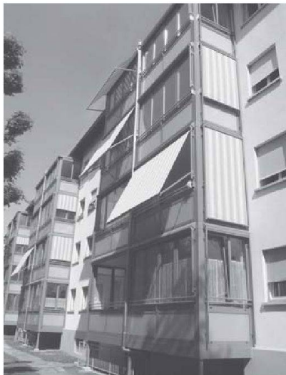
grosser isolierter Wintergarten als Zusatzzimmer nutzbar

Den Wintergarten sieht man. Ueber 5'000m2 Böden inkl. Unterboden, Schallschutz und Parkett wurden auch saniert.