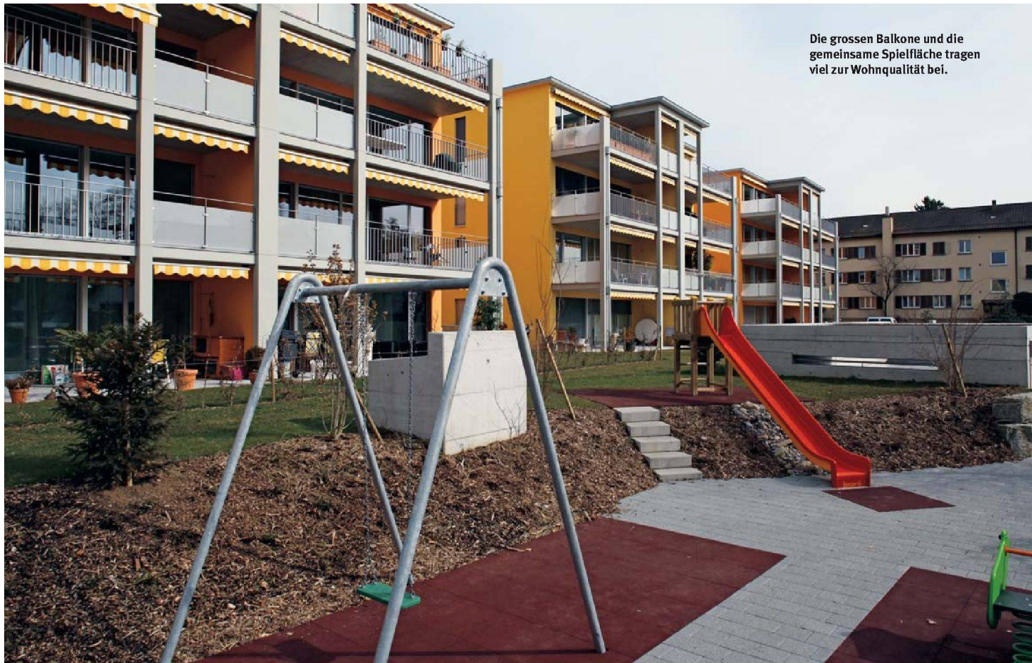
Die grossen Balkone und die gemeinsame Spielfläche tragen viel zur Wohnqualität bei.