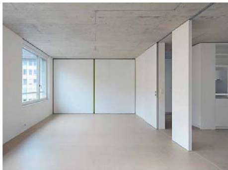
Sesam schliesse dich: der hintere Raum kann wahlweise abgetrennt (links) oder offen gelassen werden.