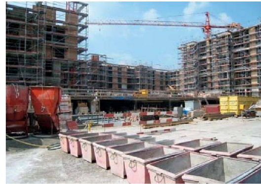
Siedlung Klee von GBMZ und Hagenbrünneli: Rückzug der Einsprache dank Gegengeschäft.