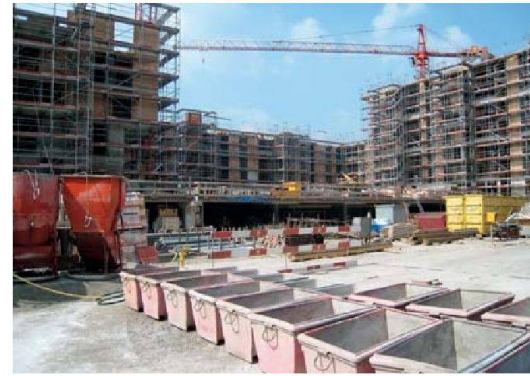
Siedlung Klee von GBMZ und Hagenbrünneli: Rückzug der Einsprache dank Gegengeschäft.