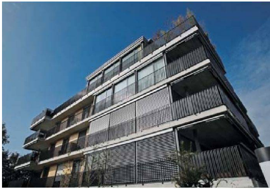
ASIG-Siedlungen Steinacker (2004) und Tägelmoo (geplanter Baubeginn 2011): Wegen Einsprachen der Nachbarn kam es zu Verzögerungen von einem Jahr beziehungsweise zwei Jahren.