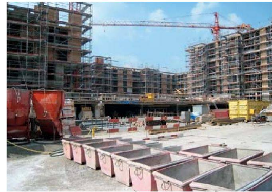
Siedlung Klee von GBMZ und Hagenbrünneli: Rückzug der Einsprache dank Gegengeschäft.