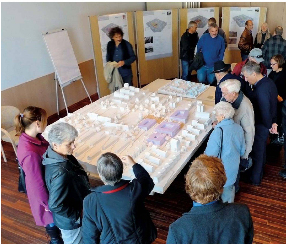
Die Zentrumsidee wurde mit einem Modell visualisiert, das an den Orientierungsversammlungen ausgestellt war.