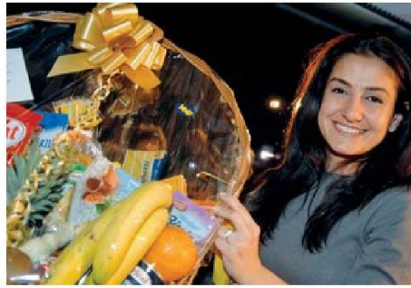
Eine tolle Verlosung und flotte Musik trugen zum gelungenen Fest bei.