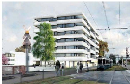
Enzmann + Fischer schlagen einen siebengeschossigen Baukörper an der Dübendorferstrasse und drei viergeschossige Bauten an der Altwiesenstrasse vor. In letzteren finden sich attraktive Maisonnettewohnungen für Familien.

Die Bau- und Wohngenossenschaft Graphis ersetzt ihre Wohnsiedlung zwischen Altwiesen- und Dübendorferstrasse in Zürich Schwamendingen. Die 1952 erstellten Bauten entsprechen in Bezug auf Wohnungsgrössen, Komfort und Energiebilanz nicht mehr den heutigen Anforderungen. Zudem ist das Grundstück heute stark unternutzt. Anstelle von 80 kleinen Altbauwohnungen können so in Zukunft mindestens 110 zeitgemässe Neubauwohnungen innerhalb der