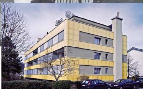
Gesamtsanierung Bifangstrasse 1+3, 4153 Reinach BL