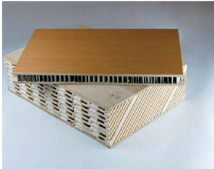
Die Leichtbautechnik von Piatti: mit Holzwerkstoff bedeckte Papierwaben.

■ Die Hersteller profilieren sich aber nicht nur über Design und Technik. Ein Schlagwort, das dieses Jahr auffällig häufig auftaucht, ist Nachhaltigkeit. Piatti macht diese sogar zum Hauptargument für seine Küchen: Das Unternehmen wurde als erster Küchenanbieter mit dem Umweltzertifikat nach ISO 14001 ausgezeichnet.