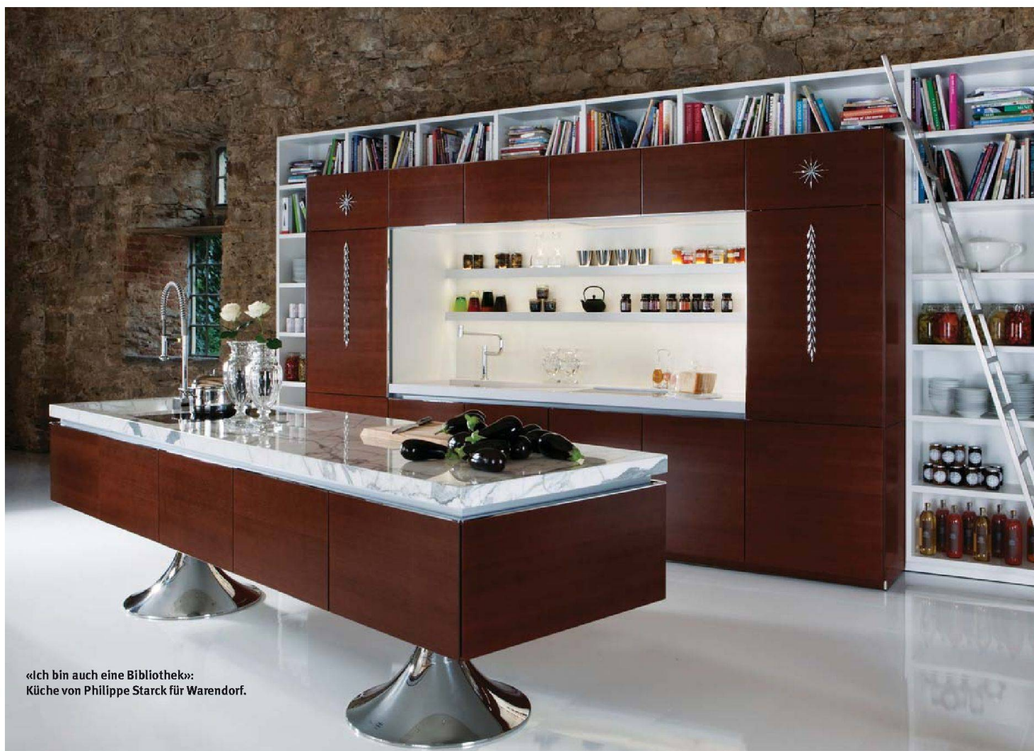
«Ich bin auch eine Bibliothek»: Küche von Philippe Starck für Warendorf.

Wohnen hat sich an der Swissbau nach Küchentrends umgesehen