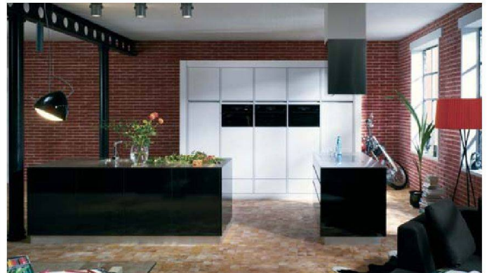
Dunkle Eleganz: Modell «Loft» von Piatti.

In diesen edlen Küchen sind die Geräte entweder diskret versteckt oder werden selbst zum repräsentativen Hingucker. Bei Sibir sah man zum Beispiel Oberflä-