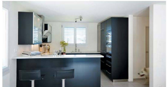
Kompakt und geschickt organisiert: Sanitas Troesch.