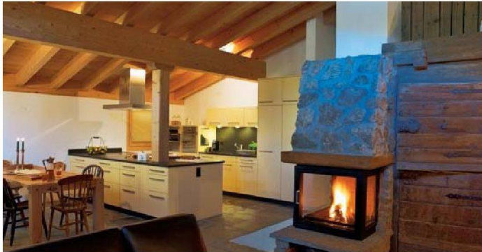
Küchen, in denen gelebt wird: Sanitas Troesch.

■ Nun wird es richtig gemütlich am Herd. Wenn man den Ausstellern glaubt, wird in den neuen Küchen längst nicht mehr «nur» gekocht (zumal die neuen Geräte ja ohnehin einen grossen Teil der Küchenarbeit übernehmen, siehe S. 51): Da findet man Zeitschriften und Sessel, integrierte Fernseher, Handys und andere interaktive Ge-