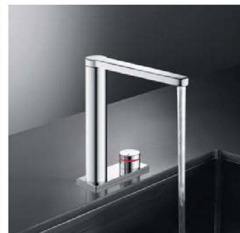
Schlichte Eleganz: Armaturen von KWC.

hindert. Bei den Dunstabzugshauben sticht ins Auge, dass diese bei fast allen Herstellern als Wandhauben konzipiert oder zumindest schräg oder seitlich angebracht sind, was dem Koch oder der Köchin mehr Bewegungsfreiheit gibt. Nützliche Neuheiten sah man