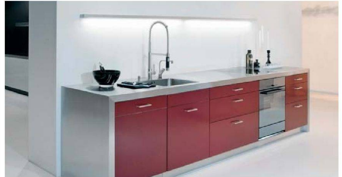
Die rote Forster-Küche steht genau so in der Minergie-P-Siedlung Leuenhof in Berneck (SG).

räte für Arbeit und Unterhaltung. Augenfälligstes Beispiel der neuen Wohnküche: Die von Starckdesigner Philippe Starck für Warendorf (ehemals Miele Die Küche) entwickelte Küche «Library» mit um den Möbelkorpus umlaufender Bibliothek. Ebenfalls eine Reverenz an vergangene Zeiten sind in den modular aufgebauten Starck-