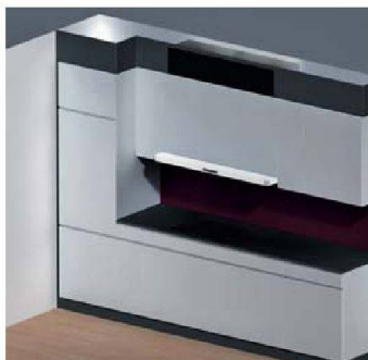
Frischlufte für Küche und Wohnraum: Wesco.

■ Aufgefallen sind ausserdem einige praktische Innovationen, die Arbeiten und Leben in der Küche einfacher machen: Wesco zum Beispiel zeigte ein Lüftungsggerät, das sowohl Küche als auch Wohnraum mit Frischluft versorgt und Energieverlust durch Lüften ver-