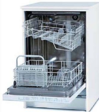
Sparsam: die neuen Geschirrspüler von Merker.

Dank einer eigens entwickelten Leichtbautechnik und breiteren Möbeln ist es möglich, pro Küche fünfzig Prozent Material einzusparen. Ausserdem setzt der Hersteller bewusst schnell nachwachsende Ressourcen und rezyklierbare Materialien sowie Geräte mit minimalem Energieverbrauch ein. Energiesparen haben sich auch