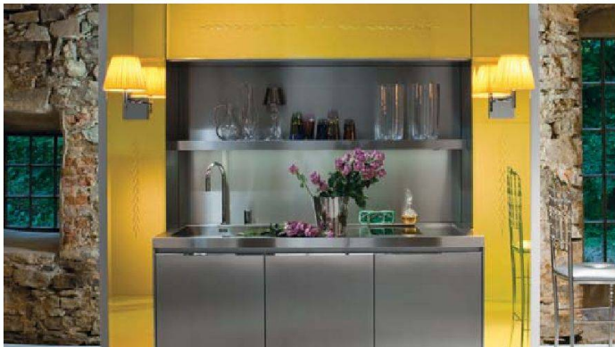
Ungewöhnliche Materialien, Farben und Dekorelemente: Starck by Warendorf.

■ Bei den Fronten sind vielfältige, zum Teil ungewohnte Oberflächen zu sehen, die einen Hauch Luxus ausstrahlen. Einen kühnen Materialmix wagt zum Beispiel Philippe Starck in seinen Küchen: Er kombiniert Edelstahlfronten mit cremeweißem Glattlack oder mit gelb verspiegeltem Glas und fein strukturiertes Macoré (afrikanischer Birnbaum) mit Edelstahl und Marmor. Seine Fronten sind zudem, und das ist in der Küche wirklich ungewöhnlich, mit Ornamenten und Wandapplikationen dekoriert. Ebenfalls ungewohnt