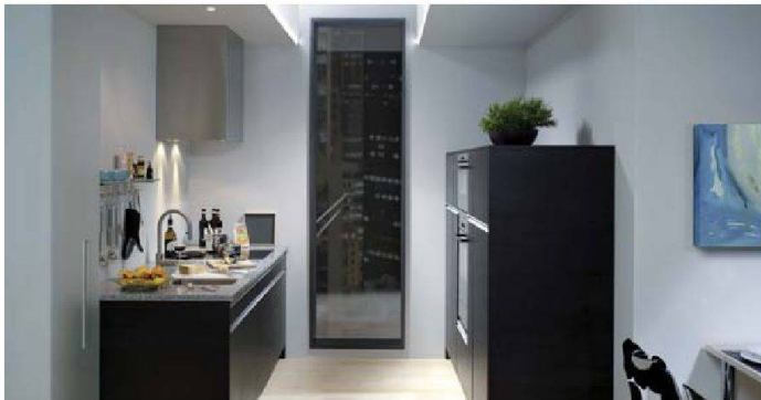
Urbane Kleinküche: Modell «Trend» von Piatti.