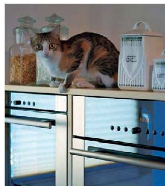
¾-Schränke schaffen zusätzlichen Stauraum (Sanitas Troesch).

■ Auch wenn an der Messe natürlich vor allem grosszügige, luxuriöse Wohnküchen vorgestellt wurden, haben einige Anbieter auch kompakte Kleinküchen im Programm, die für Baugenossen-