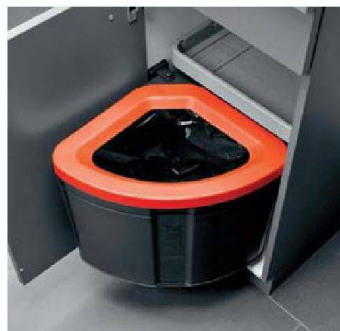
Platz für den Abfallsack: Franke.

■ Aufgefallen sind ausserdem einige praktische Innovationen, die Arbeiten und Leben in der Küche einfacher machen: Wesco zum Beispiel zeigte ein Lüftungsggerät, das sowohl Küche als auch Wohnraum mit Frischluft versorgt und Energieverlust durch Lüften ver-