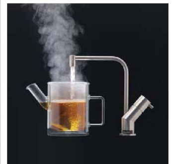
Kochendes Wasser aus dem Hahn: «Quooker».

auch bei Franke: etwa einen Abfallbehälter, der so gross ist, dass ein 35-Liter-Abfallsack darin auch tatsächlich gefüllt werden kann, oder ein Spülbecken, das sich leicht und hygienisch reinigen lässt. Bei mehreren Herstellern zu sehen war der «Quooker»: ein