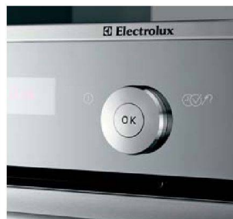
Der Herd, der mitdenkt: «Inspiro» von Electrolux.