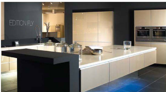
Schwebende Küchenmöbel: Serie «Fly» von Alno.