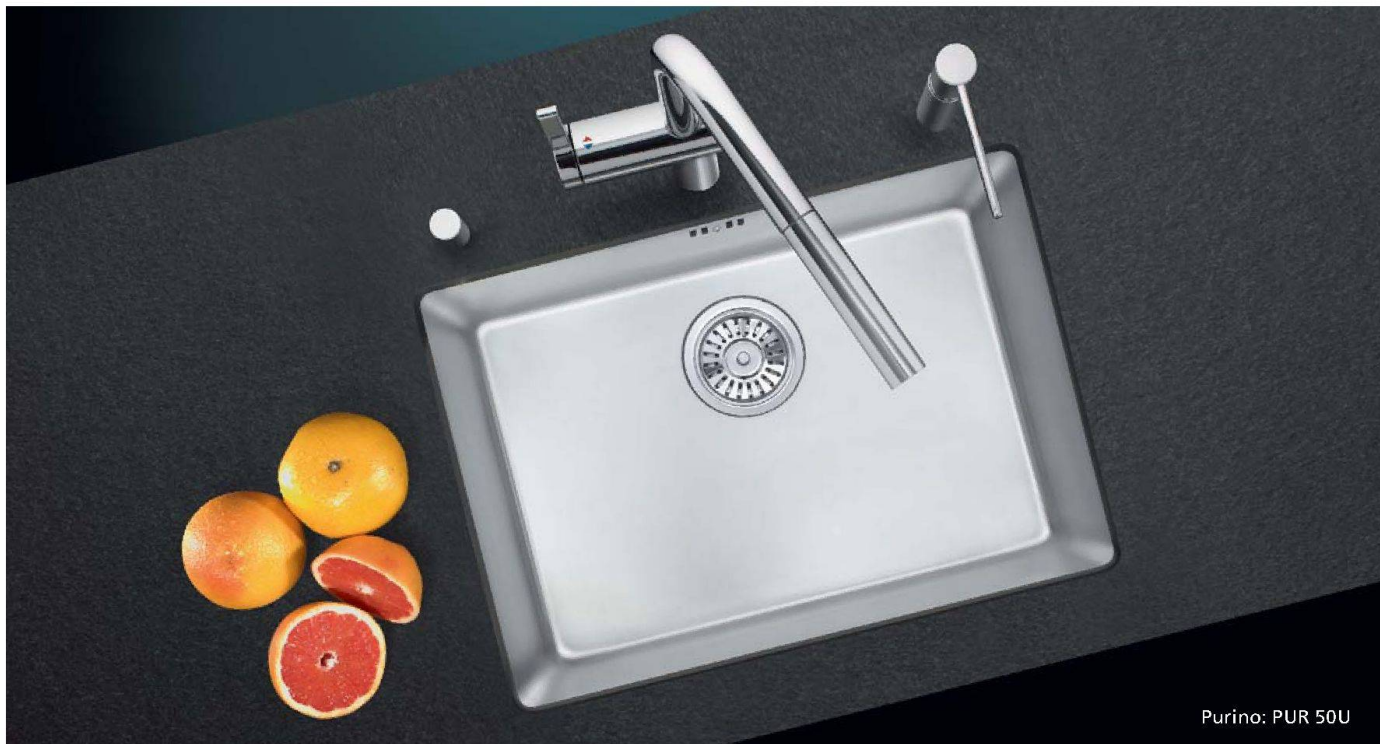
Purino: PUR 50U

Für jedes Küchenkonzept und jedes Budget.