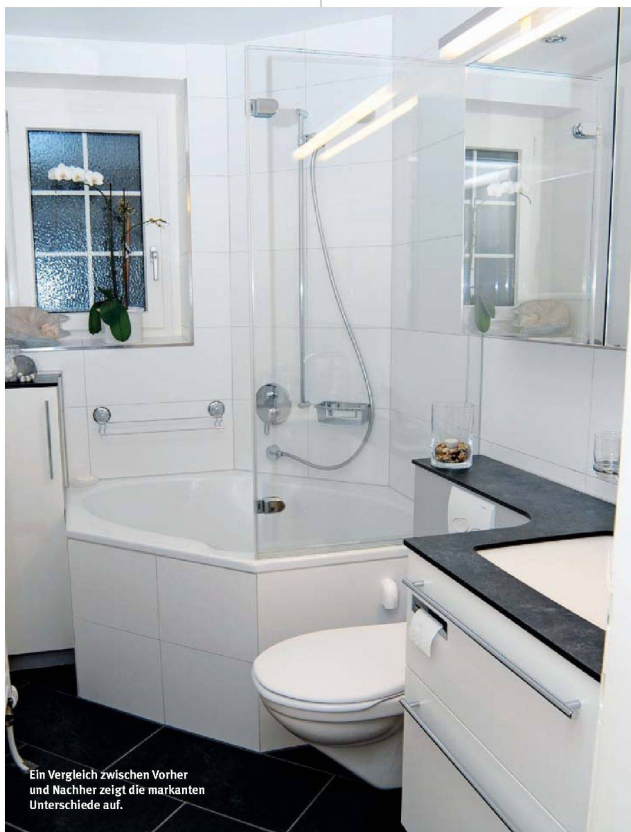
Ein Vergleich zwischen Vorher und Nachher zeigt die markanten Unterschiede auf.

Vier Varianten schlug die Projektleitung vor. Dabei erstellte sie im Keller der Liegenenschaft von der favorisierten Lösung gar ein