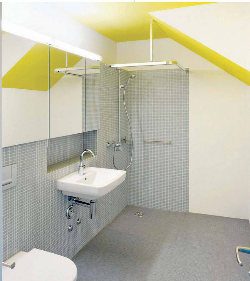
Die Bäder sind hindernisfrei eingerichtet.