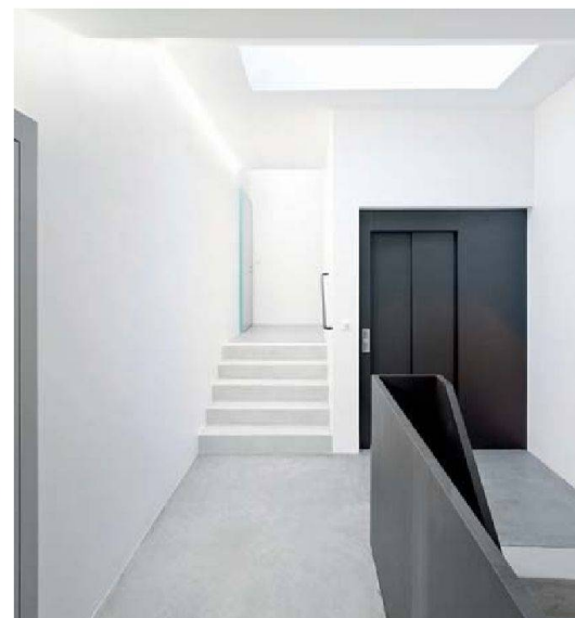
Im neuen Treppenhaus findet sich auch ein Lift.