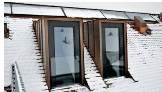
Oberhalb der Dachgauben befinden sich unauffällig integrierte Sonnenkollektoren.