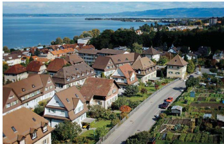
Viele Eisenbahnersiedlungen der Gründerzeit – im Bild die EBG Rorschach – orientierten sich am Modell der Gartenstadt.

aufbauten hervor. Andere bedeutende Zeugnisse sind beispielsweise die Arbeitersiedlungen der Eisenbahner in Bern, St. Gallen oder Rorschach, die sich architektonisch und städtebaulich am Modell der englischen Gartenstadt orientieren. Durchgrünte Bereiche, geschwungene Strassen und unterschiedliche Haustypen machen diese Siedlungen zu dorffähnlichen Kolonien. Zugleich zeugen die Eisenbahnersiedlungen vom wachsenden Selbstverständnis und vom Selbstbewusstsein der Arbeiter.