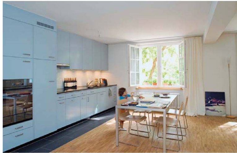
Vor fünf Jahren erneuerte die BEP ihre erste Siedlung Industrie I. Dank umfassender Modernisierung und Zusammenlegungen sind die Wohnungen heute wieder attraktiv für Familien. Die neuen Balkontürme im Hof bieten privaten Aussenraum.