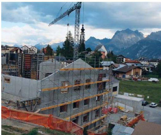
In Ftan (GR) führte der touristische Wohnungsbau zu Preisdruck und Mangel an Mietwohnungen. Deshalb gab die Gemeinde der neu gegründeten Genossenschaft Chasa Reisgia Land im Baurecht ab, um dort bezahlbaren Wohnungen für die lokale Bevölkerung zu schaffen.