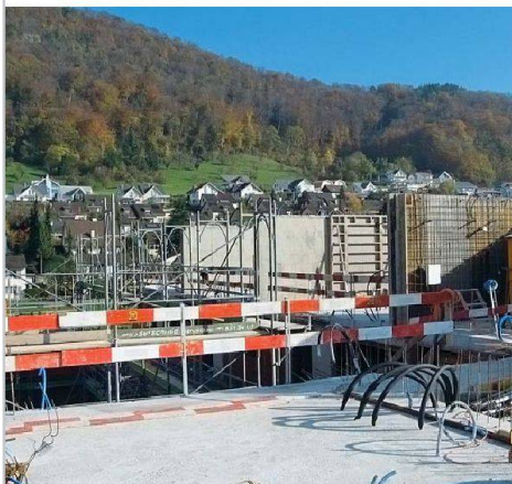
In Lausen (BL) schuf die Gemeinde mit der Gründung der Seniorengenossenschaft Lausen dringend benötigten altersgerechten Wohnraum.