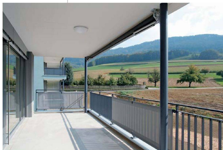
Wander- und Spazierwege liegen direkt vor der Haustüre.