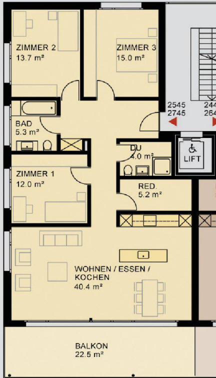
Grundriss einer 4 1/2-Zimmer-Wohnung mit 110 Quadratmetern Wohnfläche.

durch den Beizug einer GU die Preise gedrückt werden, sei indes nicht von der Hand zu weisen. Weil die Genossenschaft die Qualität stärker betonen und möglichst viele Betriebe aus der Region berücksichtigen wollte, habe man sich für die direkte Auftragsvergabe durch den Architekten in Absprache mit der Genossenschaft entschieden.