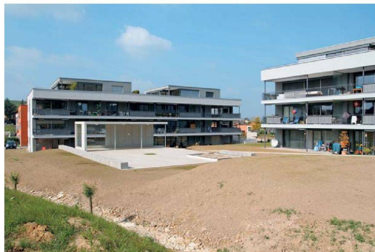
Im Aussenraum verfügen die Bewohner über einen gemeinsamen Pavillon.