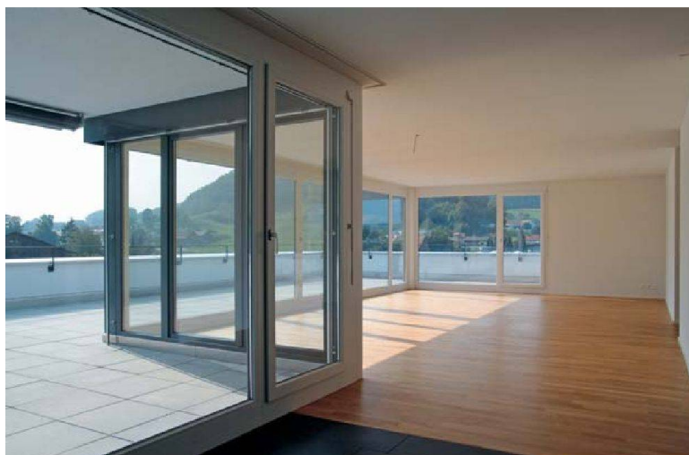
Die meisten Wohnungen richten sich nach Südwesten aus und profitieren von viel Sonneneinstrahlung.