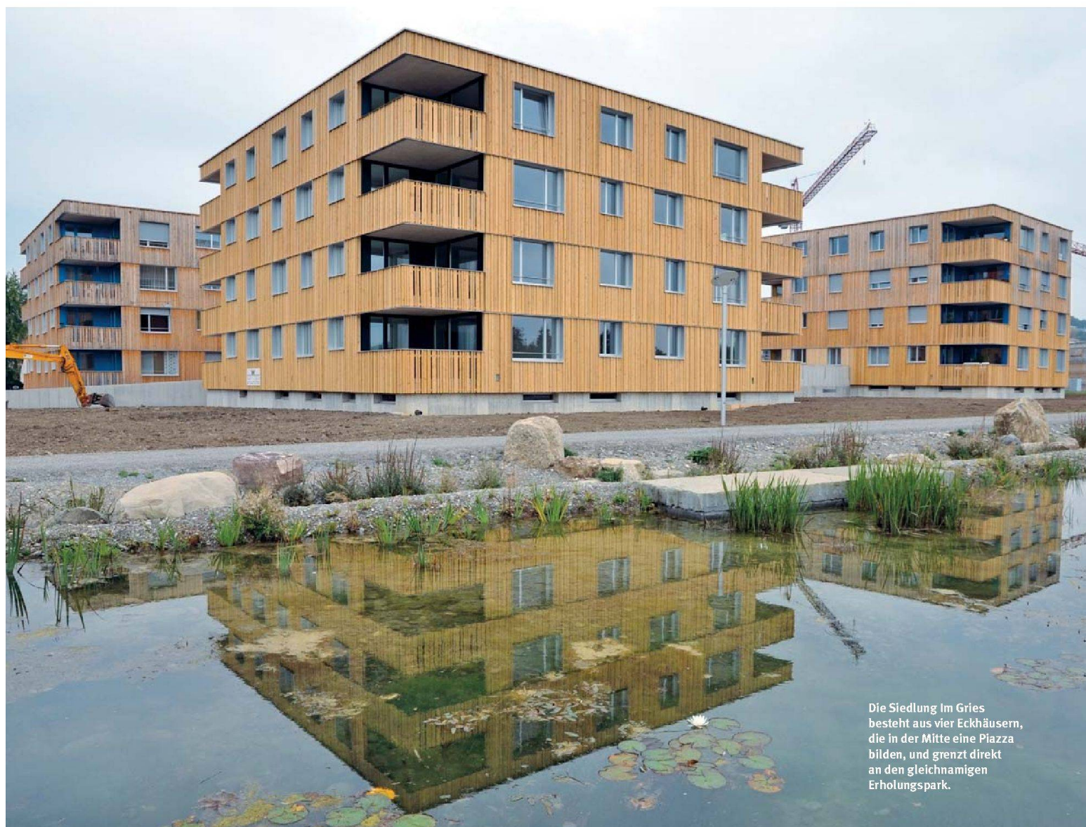
Die Siedlung Im Gries besteht aus vier Eckhäusern, die in der Mitte eine Piazza bilden, und grenzt direkt an den gleichnamigen Erholungspark.

Bahoge baut in Volketswil hochwertige Neubausiedlung