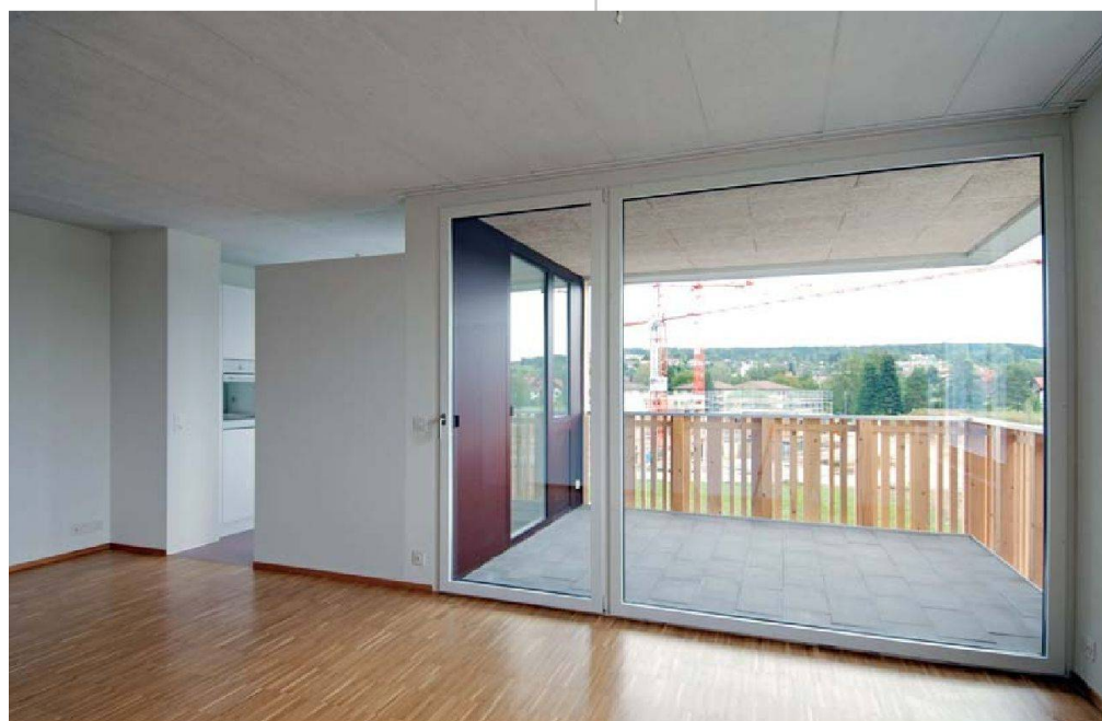
Die Wohnungen bestechen mit grosszügigen Räumen, breiten Fensterfronten und Loggia.