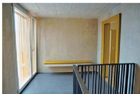
Überraschend hoher Ausbaustandard auch im Treppenhaus (mit Sitzbank): Jede Wohnung hat eine eigene Farbe, die sich im Wohnungsinnern fortsetzt.

Hotels. Auch die auf Flexibilität angelegten Wohnungsgrundrisse zeugen von der Weitsicht der Bauherren.