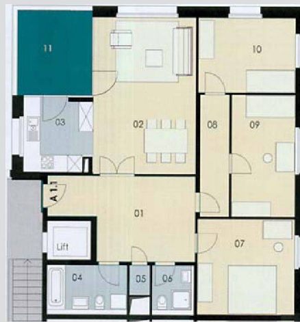
Jeder Wohnung ist eine Farbe zugeordnet, die schon an der Türe und Loggia erkennbar ist und sich in Details im Wohnungsinnen (z. B. im Bad) fortsetzt.

Zeitplan konnten trotzdem eingehalten werden. Dafür sorgte eine Baukommission aus Architekt und Vertretern der Bahoge. Realisiert wurden die Bauarbeiten nicht mit einem GU, sondern mit Einzelunternehmen. «Damit sind wir sehr gut gefahren», erklärt Erich Rimml. Die Preisexplosion beim Stahl Anfang 2008 sorgte zunächst für einige Engpässe, dies konnte aber durch eine strikte Kostenkontrolle aufgefangen werden. Die Siedlung kann durchaus mit den Minergieanforderungen mithalten. Aus Kostengründen verzichtete man aber auf eine Komfortlüftung. Die Neubauten decken ihren Energiebedarf mit einer Holzpellettheizung sowie Sonnenkollektoren auf den Flachdächern, die das Warmwasser für die Wohnungen liefern und die Heizung unterstützen.