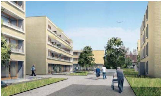
Hier sollen sich alte Menschen und Familien wohlfühlen: die geplante Siedlung Breitipark der WSGZ.

An der Breitistrasse in Bassersdorf erstellt die Wohn- und Siedlungsgenossenschaft Zürich (WSGZ) eine Wohnüberbauung mit 54 Mietwohnungen, einem Kindergarten, Spitex- und Gemeinschaftsräumen sowie einer Altersberatung. Im Rahmen einer Neugestaltung des Dorfzentrums, die auch den Bau dringend benötigter Alters- und Familienwohnungen umfasst, hatte sich die Gemeinde für die Zusammenarbeit mit der Investorengruppe WSGZ/Allreal/Genossenschaft Zukunftswohnen entschieden. Aus einem Architekturwettbewerb ging das Projekt von Oberholzer + Rüegg (heute: Rüegg Architekten AG) aus Rapperswil als Sieger hervor (vgl. wohnen 10/2007).