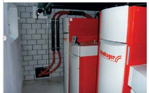
Die Biwog ersetzt eine Ölheizung durch Pellets.

Um den Wintervorrat an Brennmaterial speichern zu können, wurden zwei Pelletkeller für insgesamt 18 Tonnen hergerichtet und aufgefüllt. Das Holz, das im Berner Seeland für Wärme sorgt, stammt aus dem nahen Emmental. Die doppelte Ausführung der Verbrennungseinheiten garantiert, dass die Wärmeherzeugung jederzeit gesichert ist. Die auf dem Dach installierten Sonnenkollektoren produzieren bei durchschnittlicher Besonnung Warmwasser im Überfluss. Dabei wird das Wasser auf 80 Grad erwärmt und in den Hauskreislauf eingespeist.