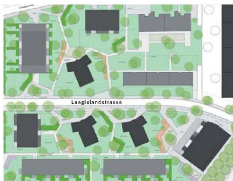
Situationsplan und Modellfoto des Siegerprojekts von Galli & Rudolf Architekten auf dem Areal Luegisland. Die Neubauten sind im Modell gelb markiert. Die drei turmartigen Bauten in der Bildmitte bleiben erhalten. Vorerst wird der Teil südlich der Luegislandstrasse mit vier Neubauten realisiert.