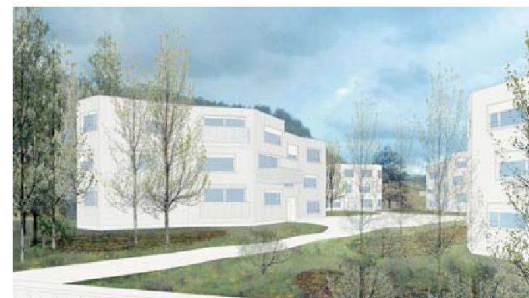
Die acht kompakten Bauten sind locker auf dem Areal am Siedlungsrand verteilt.