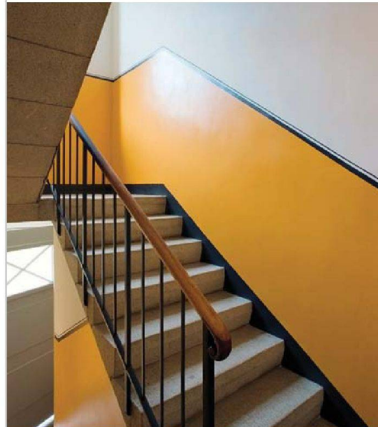
Auch die Treppenhäuser erneuerte man originalgetreu.