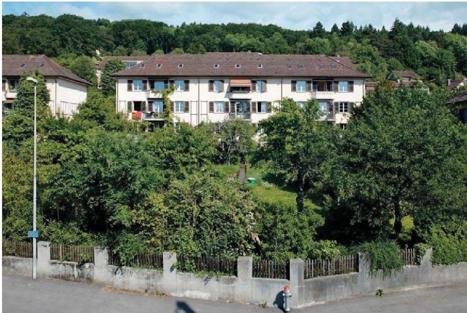
Architekt Eduard Lanz erstellte die Siedlung Sonnhalde nach der Gartenstadt-Philosophie.