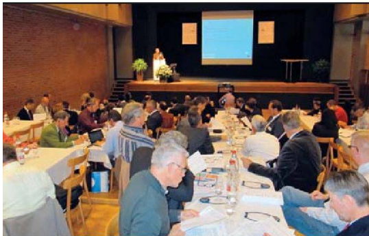
«Bildung» lautete das Thema der diesjährigen Grenchner Wohntage.