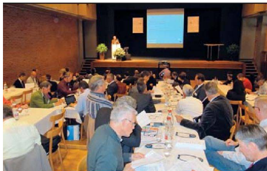
«Bildung» lautete das Thema der diesjährigen Grenchner Wohntage.