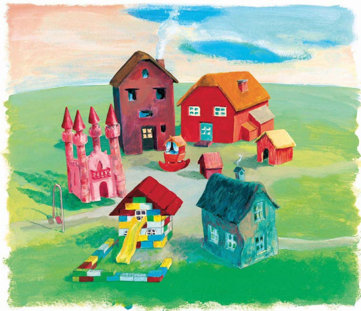
Illustration: Monika Zimmermann

Mehrgenerationenhäuser aus der Sicht von Zeichnerin Monika Zimmermann: Auf unserer Dänemarkreise werden solche in natura zu sehen sein, und wie Genossenschaften ihre verschiedenen Häusern Generationen entwickeln sollten, lernen Sie in Modul 5 unseres Lehrgangs.