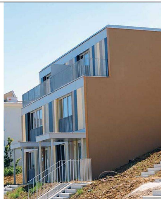
Blick auf talseitige Fassade mit Eingang und Terrasse.