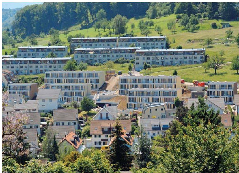
Die sechs unterschiedlich grossen Blöcke der Siedlung Leimenmatt befinden sich zwischen Einfamilienhäusern (unterhalb) und einer grossen Reihenhaussiedlung (oberhalb).