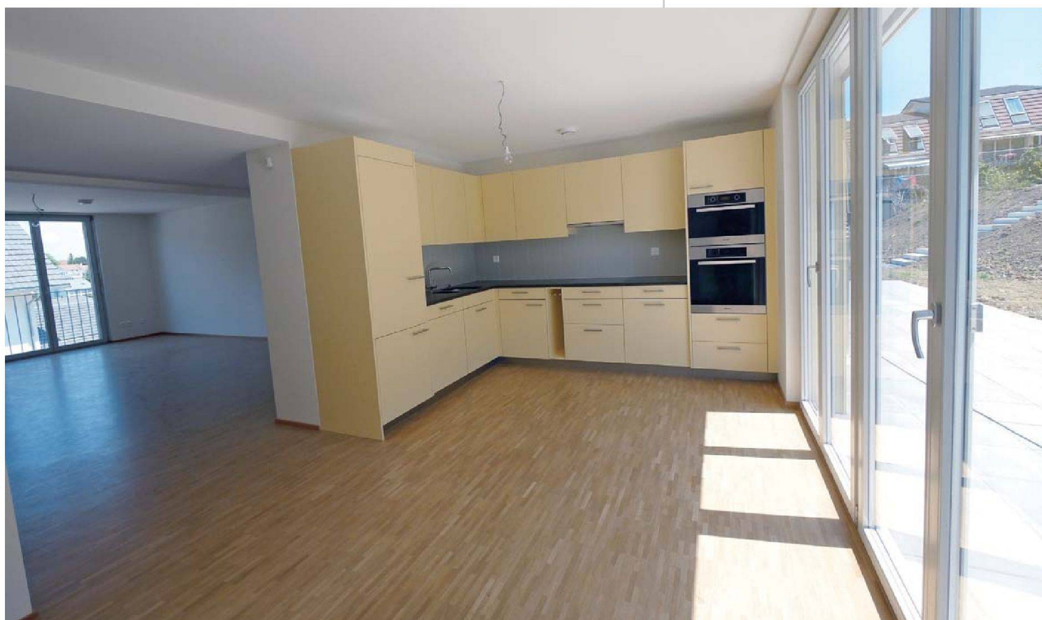
Viel Licht: Wohnen/Essen/Küche im Viereinhalbzimmerhaus.