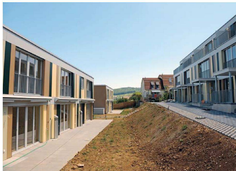
Bergseitig hat jedes Haus einen Sitzplatz, talseitig befinden sich die Eingänge sowie eine Terrasse mit weiter Aussicht.