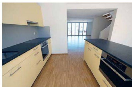
Blick in Küche und Wohnzimmer des Fünfeinhalbzimmerhauses.