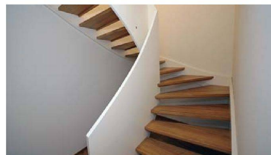
Stimmungsvolle Innentreppe gehören zum Reihenhauses-Ambiente.