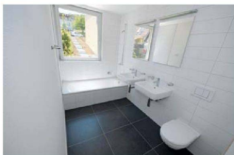
Elegante grossflächige Platten bestimmen die Bäder.