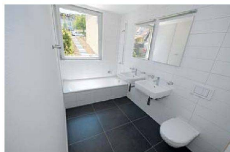
Elegante grossflächige Platten bestimmen die Bäder.