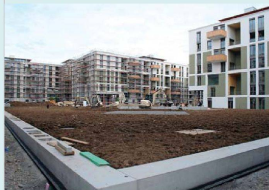
Blick in den Innenhof der Siedlung «Klee».

Eine stattliche Anzahl Mitglieder des Regionalverbands nutzte die Gelegenheit, um am 17. September die fast fertige Neubausiedlung Klee in Zürich Affoltern zu besichtigen. Das wundert kaum, stösst das Projekt der Baugenossenschaften GBMZ und Hagenbrünneli mit seinen 340 Wohneinheiten doch in ungewohnte Dimensionen vor. Insbesondere der riesige Innenhof beeindruckte. Viel zu reden gaben auch die Wohnungen. Einmal mehr entwarf das Büro Knapkiewicz & Fickert hier eine Vielfalt von Grundrissen, die fast ohne Verkehrsflächen auskommen. Tüpfelchen auf dem i sind die Waschküchen im Siedlungsteil der GBMZ, die in Pavillons auf dem Dach untergebracht sind. Besondere Bedeutung hat die imposante Überbauung für den SVW-Regionalverband Zürich, ist der Landerwerb seinerzeit doch durch die Vermittlung der