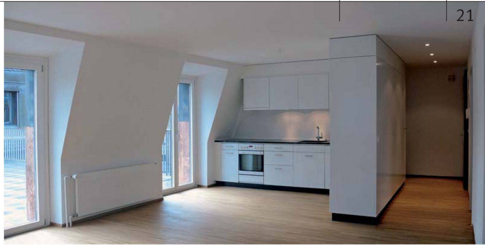
Blick in eine erneuerte Dachwohnung.