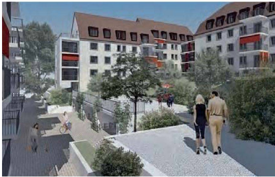
Visualisierungen des neugestalteten Hofes, des Zwischenbaus sowie der Küche, von der man neu direkt auf den Balkon gelangt.

Küchen und Bäder einschliesslich Installationen wurden komplett erneuert und auf zeitgemässen Standard gebracht. Grosse Aufmerksamkeit schenkte die Genossenschaft dem von den Bewohnern monierten Schallschutz. So erhielten alle Böden einen schalldämmenden Aufbau aus zwei Zentimetern Mineralwolldämmung und zwei Fermacellplatten, auf die der neue Klebeparkett oder die Steinzeugplatten zu liegen kamen. Die Wärmedämmung umfasste neben der Fassade die Isolation der Kellerdecken und Estrichböden sowie das Ausflocken der Mansardengeschossdächer. Bei der Wärmeversorgung entschied man sich für