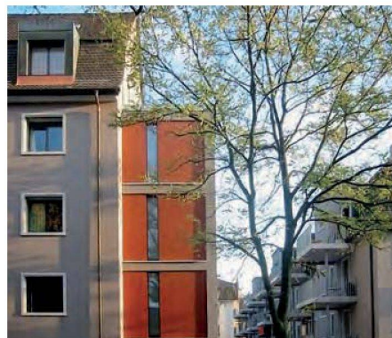
Mit einem Zwischenbau sowie zwei Anbauten schuf die MBGZ zusätzlichen Wohnraum.