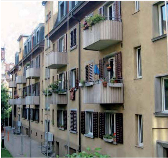
So präsentierten sich die Hoffassaden vor der Erneuerung.