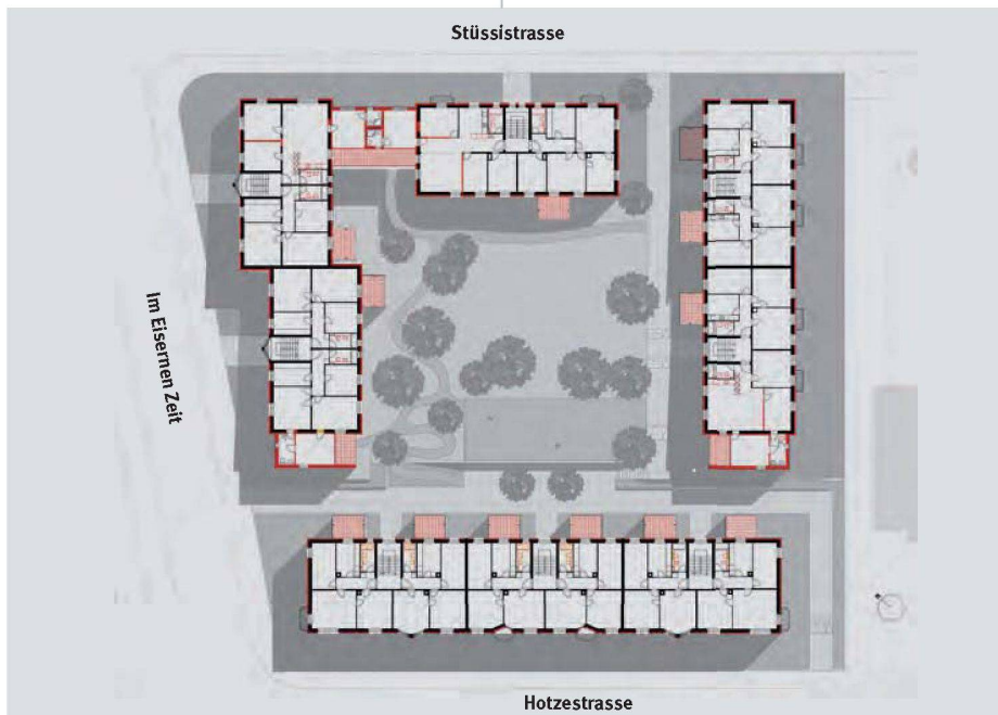
Lageplan der Siedlung «Im Eisernen Zeit» oberhalb des Schaffhauserplatzes.