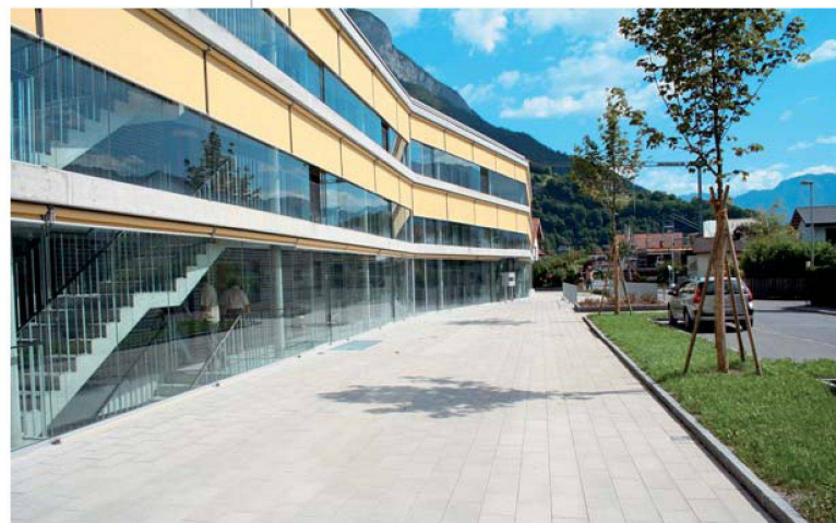
Die Sonnenstoren reagieren automatisch auf den Lichteinfall und verhindern zu hohe Temperaturen in den Begegnungszonen.