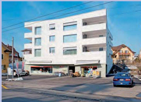
Der Zentrumsbau bildet den Abschluss des Dorfplatzes, der als lebendiger Begegnungsort gestaltet wird. Dabei spielt der im Erdgeschoss eingerichtete Supermarkt eine wichtige Rolle.