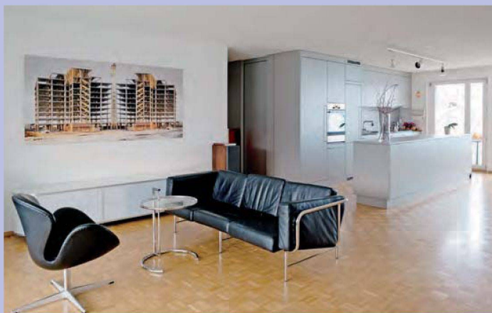
«Durchgehendes Wohnen» hiess das Prinzip bei der Wohnraumgestaltung. Dazu tragen die neuen offenen Küche ebenso bei wie die grosszügigen Glasflächen.