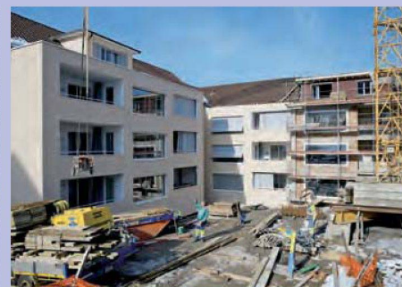
Auf der Hinterseite des Z-Blocks durften Anbauten und neue Balkone erstellt werden.