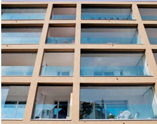
Die vergrösserten Balkone, die sich dank faltbaren Gaselementen in Wintergärten verwandeln lassen, prägen die Südfassade.