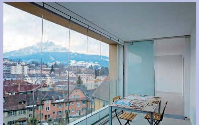
Dank verglasten Balkonen lässt sich die Aussichtslage noch mehr geniessen.