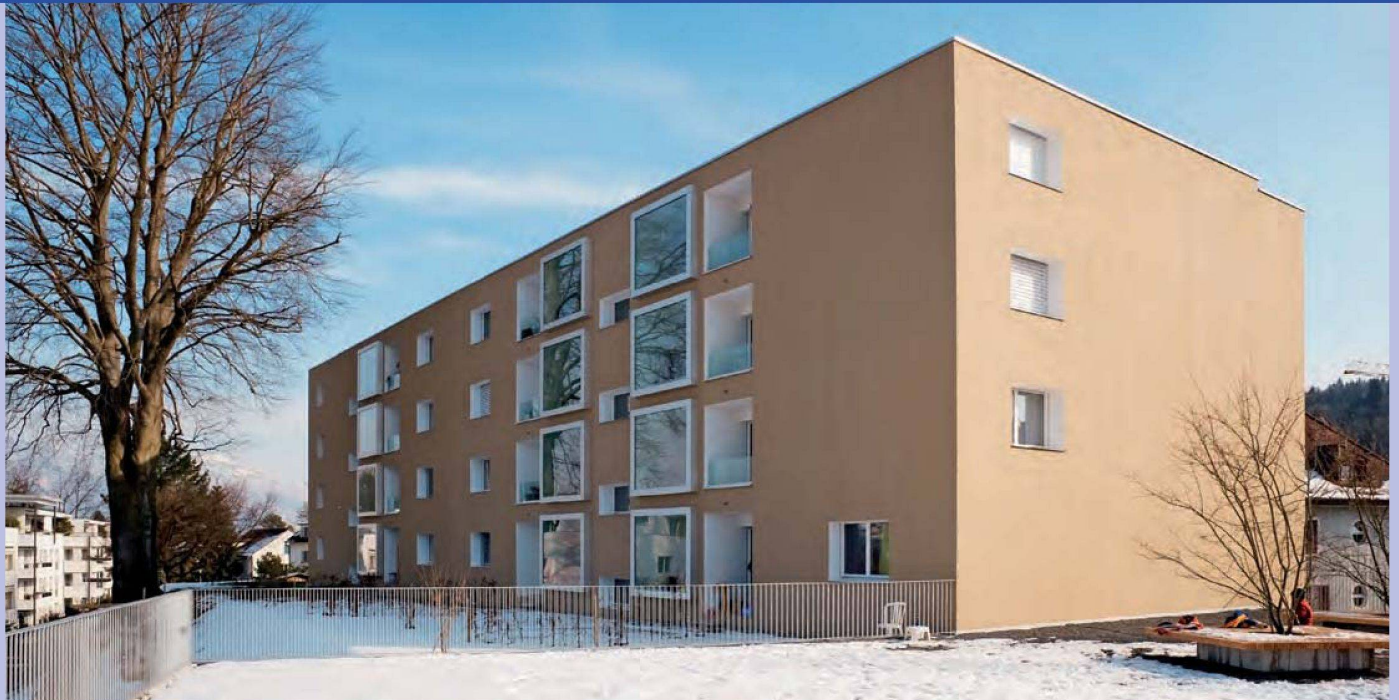
Am Höhenweg erneuerte die EBG Luzern einen 1960er-Jahr-Bau umfassend. Auf der Nordseite ergänzte man die Wohnungen mit grossflächigen Kastenfenstern.