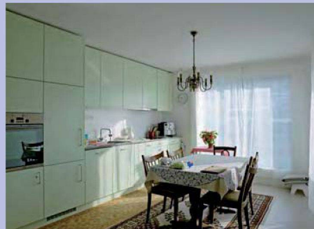
Viel Licht auch in den modernen Wohn-/Essküchen.