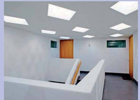
Die Fassadenmuster finden sich im Treppenhaus wieder.