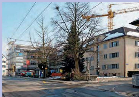
Der Z-Block befindet sich in einer geschützten Zone. Deshalb war auf der Strassenseite nur eine minimale Isolierung möglich.