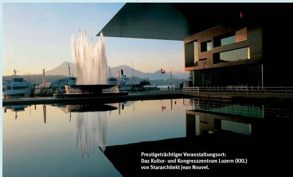
Prestigeträchtiger Veranstaltungsort: Das Kultur- und Kongresszentrum Luzern (KKL) von Stararchitekt Jean Nouvel.

Am besten merken Sie sich diesen Termin bereits vor. Die Einladung mit detailliertem Programm wird voraussichtlich im Mai versandt.