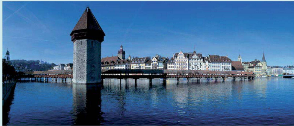
Luzern ist der künftige Schauplatz des Forums der Wohnbaugenossenschaften.