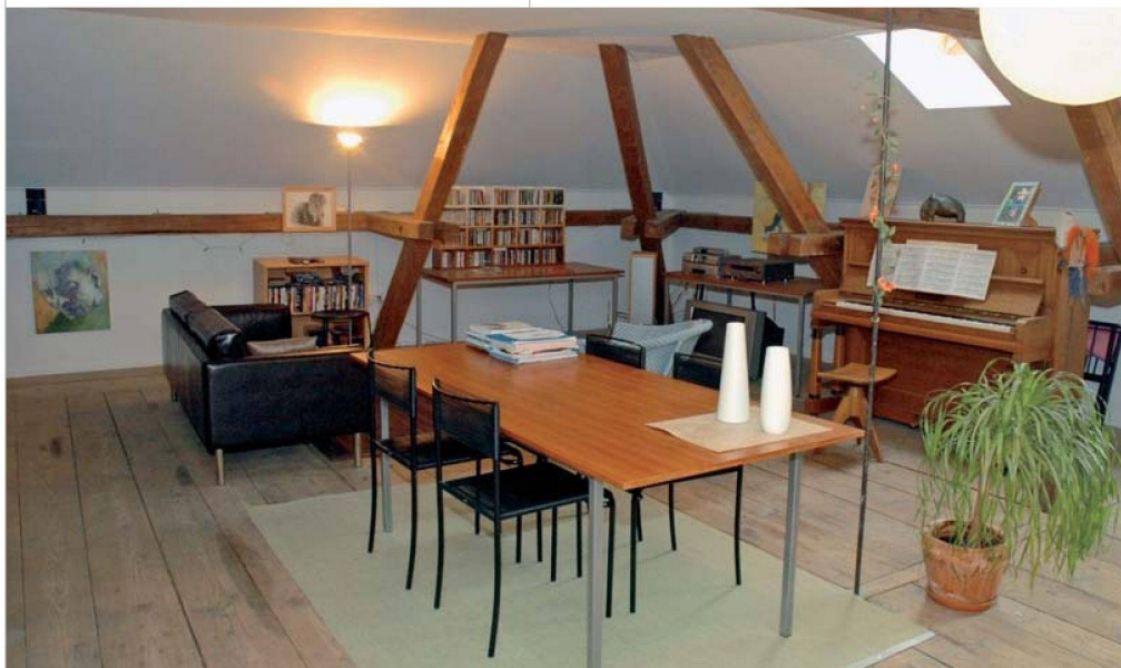
Fünf stimmungsvolle und individuelle Wohnungen gibt es nach dem Umbau.

Überraschend sind die neuen Verwendungszwecke. Beispiel OP: Wo einst geboren oder operiert wurde, schneidet der Filmer Thomas Karrer heute seine Werke. Überall pulsiert neues Leben, wie der Rundgang durch das weitläufige Gebäude mit seinen rund fünfzig Räumen zeigt. Praktisch jede der fünf Wohnungen weist ein anderes Cachet auf; die meisten sind mit modernem Standard ausgerüstet worden. Auch Gäste