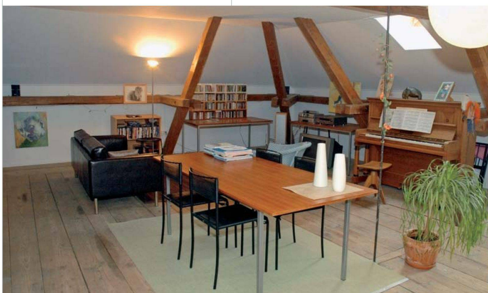
Fünf stimmungsvolle und individuelle Wohnungen gibt es nach dem Umbau.

Überraschend sind die neuen Verwendungszwecke. Beispiel OP: Wo einst geboren oder operiert wurde, schneidet der Filmer Thomas Karrer heute seine Werke. Überall pulsiert neues Leben, wie der Rundgang durch das weitläufige Gebäude mit seinen rund fünfzig Räumen zeigt. Praktisch jede der fünf Wohnungen weist ein anderes Cachet auf; die meisten sind mit modernem Standard ausgerüstet worden. Auch Gäste