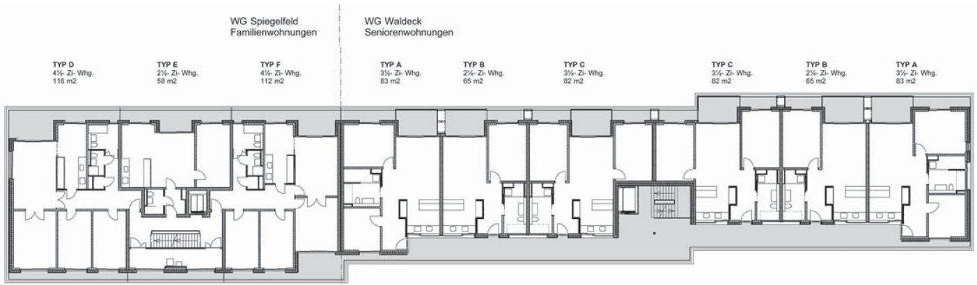
Grundrisse 1. bis 3. Obergeschoss: Links drei Familienwohnungen, rechts Seniorenwohnungen.