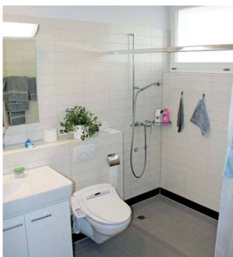
Das Bad ist hindernisfrei eingerichtet.

somat, Steamer oder ein fixer Garderobeneinbau: Die Wünsche wurden – gegen einen Aufpreis beim Mietzins – gerne berücksichtigt.