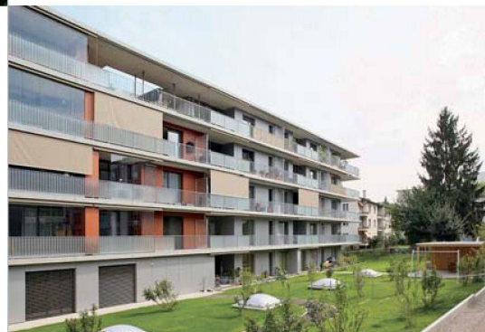
Gartenseite: Links die Senioren-, rechts die Familienwohnungen.