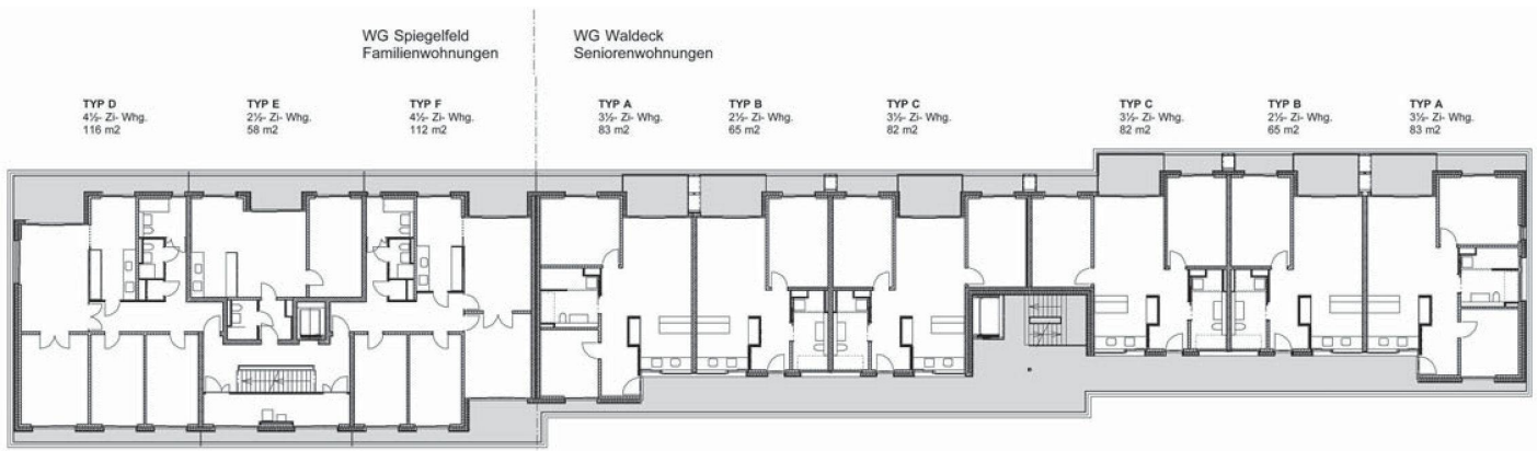
Grundrisse 1. bis 3. Obergeschoss: Links drei Familienwohnungen, rechts Seniorenwohnungen.