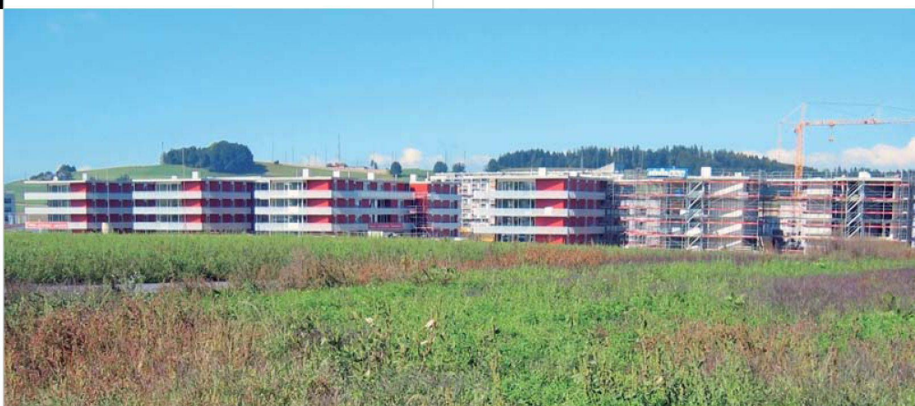
Eine Wohnung pro Stockwerk und damit eine Orientierung gegen vier Seiten bietet die Siedlung «come west», wo die Fambau Eigentum anbietet.