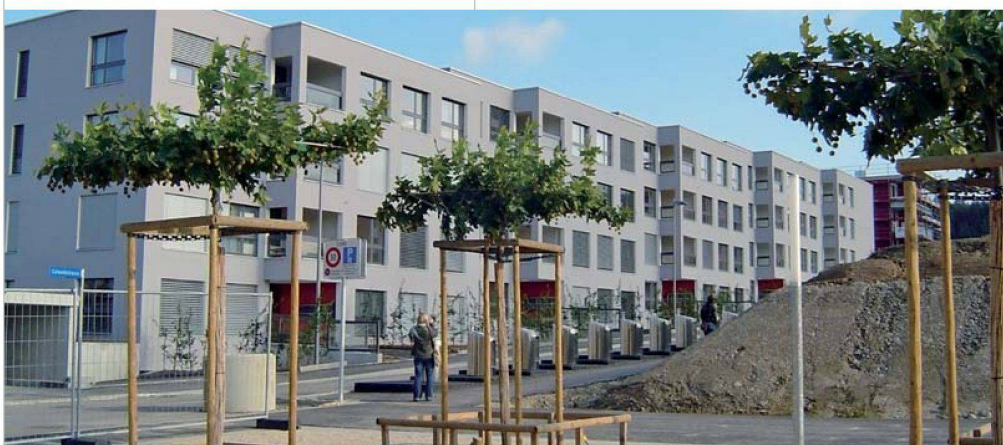
Komfortable Miet- und Eigentumswohnungen: Überbauung «brünnenleben» der Baugenossenschaft Brünnen-Eichholz.

Neben den benachbarten Türmen der Hochkonjunkturzeit mögen die Novizen mit ihren drei oder vier Geschossen bescheiden erscheinen. Doch der Eindruck täuscht: Die Dichte wird in Brünnen nicht weniger gross sein als im nahen Tscharnegut. Kompakt wirkt denn auch die Fambau-Siedlung «come west», die sich auf zwei Baufeldern erstreckt. Die Laubengänge, mit denen die viergeschossigen Häuser verbunden sind, verstärken diesen Eindruck. Das Projekt des Architekturbüros Regina und Alain Gonthier aus Bern ist das Resultat eines Architekturwettbewerbs. Schon als