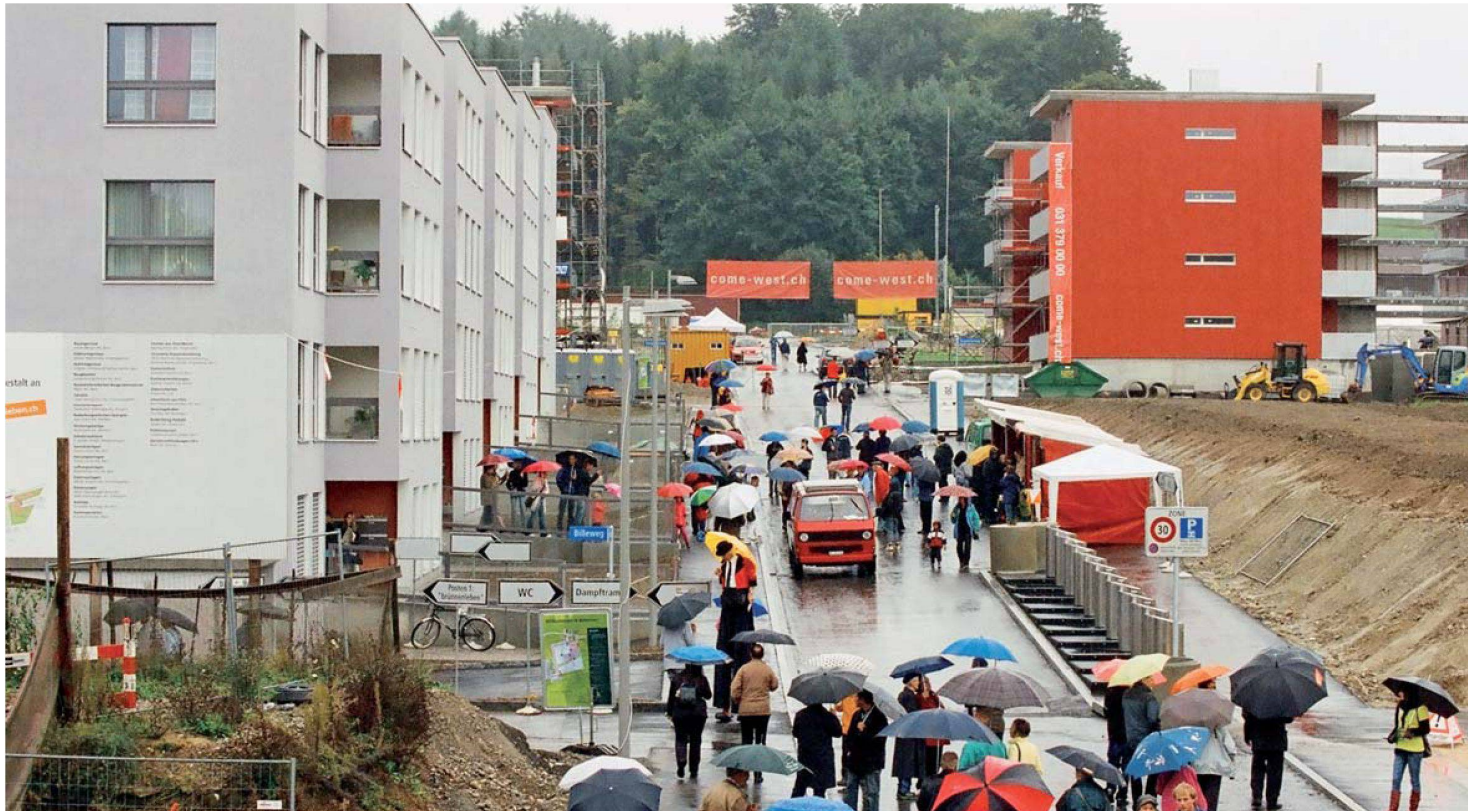
Verregener Eröffnungstag im neuen Stadtquartier Bern Brünnen: Links die Siedlung «brünnenleben» der Baugenossenschaft Brünnen-Eichholz, rechts «come west» der Fambau.