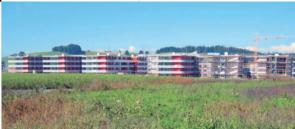
Eine Wohnung pro Stockwerk und damit eine Orientierung gegen vier Seiten bietet die Siedlung «come west», wo die Fambau Eigentum anbietet.