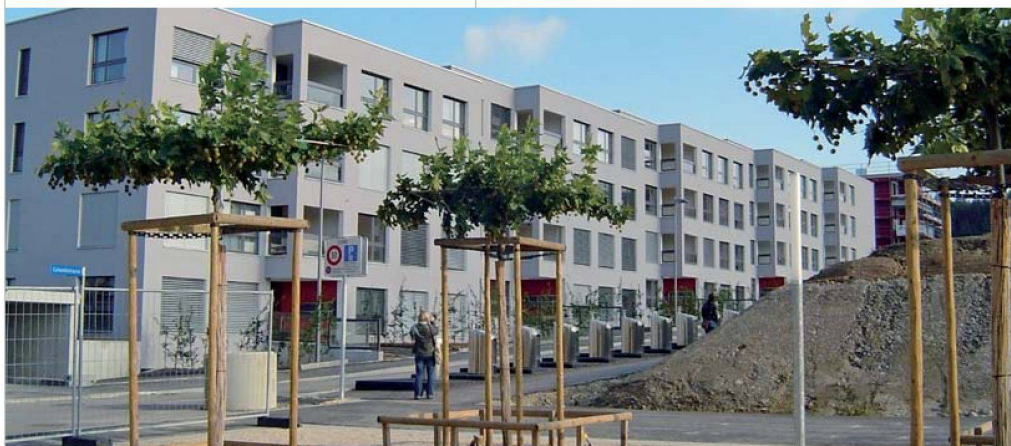
Komfortable Miet- und Eigentumswohnungen: Überbauung «brünnenleben» der Baugenossenschaft Brünnen-Eichholz.

Neben den benachbarten Türmen der Hochkonjunkturzeit mögen die Novizen mit ihren drei oder vier Geschossen bescheiden erscheinen. Doch der Eindruck täuscht: Die Dichte wird in Brünnen nicht weniger gross sein als im nahen Tscharnegut. Kompakt wirkt denn auch die Fambau-Siedlung «come west», die sich auf zwei Baufeldern erstreckt. Die Laubengänge, mit denen die viergeschossigen Häuser verbunden sind, verstärken diesen Eindruck. Das Projekt des Architekturbüros Regina und Alain Gonthier aus Bern ist das Resultat eines Architekturwettbewerbs. Schon als