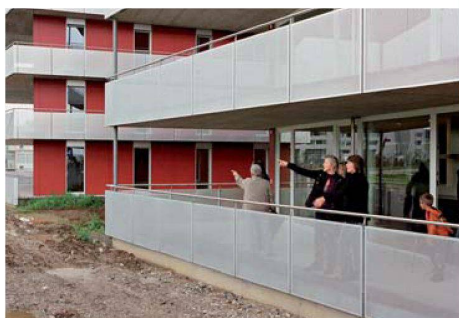
Die Wohnungen (hier «come west») stiessen auf grosses Interesse