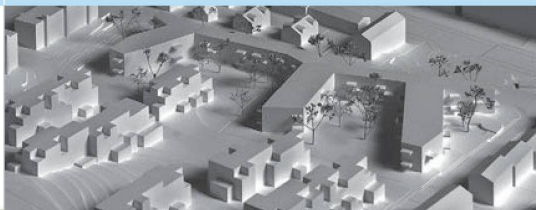
Der langgezogene Bau mit den drei Fingern bietet wirkungsvollen Schutz vor den Immissionen der Furttalstrasse – auch für die dahinterliegende städtische Siedlung.