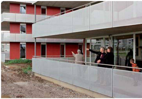
Die Wohnungen (hier «come west») stiessen auf grosses Interesse