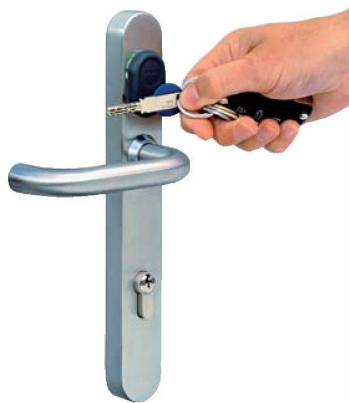
Mechatronischen Schliesssystemen gehört die Zukunft. Dank der eingebauten Elektronik kann der Liegenschaftsbesitzer Schlüssel selbst sperren und entsperren.