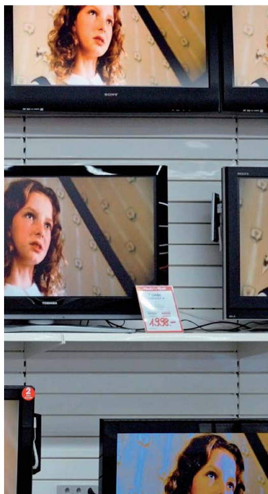
Welche Alternativen gibt es zur Cablecom? Der Angebotsdschungel im TV-Bereich macht es für die Liegenschaftsbesitzer nicht einfach.

neben Telefon- und Internetdiensten auch TV anbietet. Unterdessen hat sich ausserdem die Swisscom eingeschaltet und dazu aufgerufen, sich schweizweit über den Bau von Glasfaserkabeln abzusprechen und jeweils gleich vier Fasern zu integrieren.