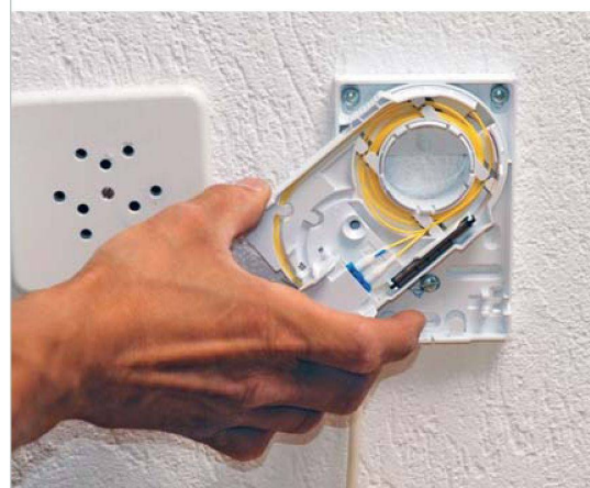
Welche Anschlüsse braucht es, damit die Liegenschaften für die künftige technologische Entwicklung bereit sind?