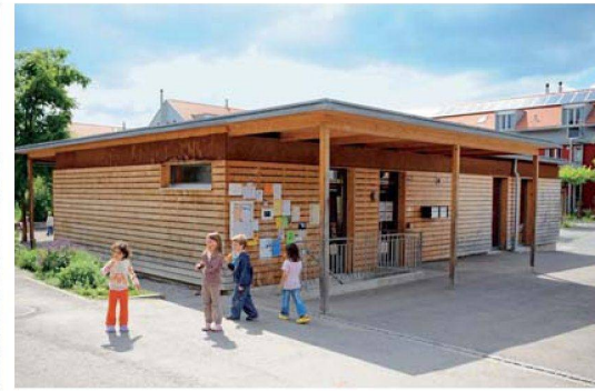
Das Herz der Siedlung: Im Gemeinschaftshaus finden zahlreiche regelmässige Veranstaltungen und spontane Treffen statt.