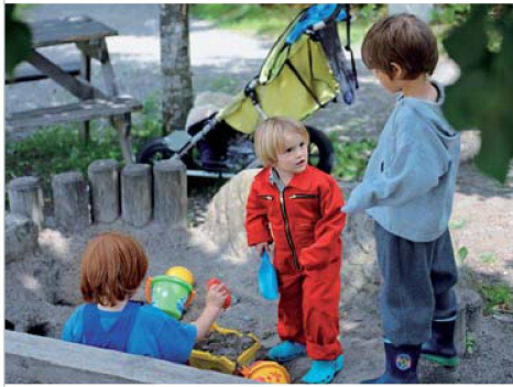
200 Kinder wohnen in der Siedlung Strassweid – das geht nicht ohne Lärm.