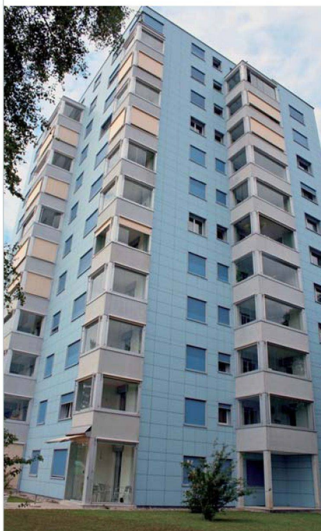
Die SILU besitzt rund um den Flughafen 900 Wohnungen. Im Bild Siedlungen in Bachenbülach und Bassersdorf.