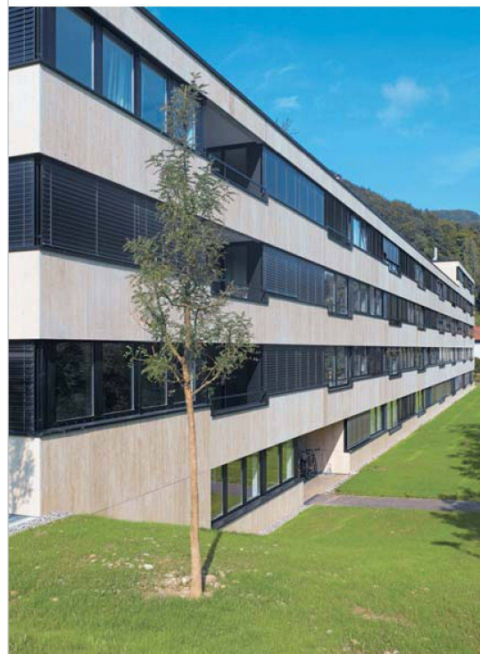
Mit der Glas-Travertin-Fassade entschied sich die Genossenschaft Hofgarten bei ihrer Siedlung Leimbach für hohe Qualität. Dafür sparte sie mit dem Verzicht auf eine Komfortlüftung eine namhafte Summe.

Wenn seitens der Genossenschaft ganz früh eine Kostensicherheit gewünscht ist