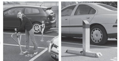
Robust, zuverlässig: «Autopa» für manuelles und «CityParker®» für automatisches Sichern des Parkfeldes.

Ihr servicestarker Partner mit innovativen Lösungen: