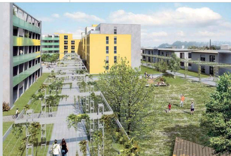
Visualisierung: Dank der vielfältigen Parkanlage wird «Giardino» nach Fertigstellung der zweiten Etappe seinem Namen alle Ehre machen.