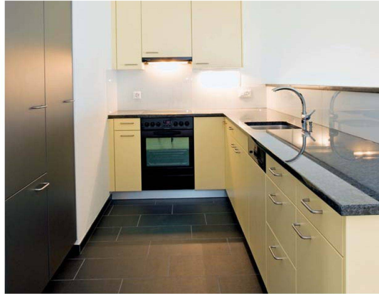
Hoher Wohnkomfort in Küche und Wohnzimmer.

Zimmer-Wohnungen bieten um die 90 bzw. 130 Quadratmeter. Um dem Anspruch generationenübergreifenden Wohnens gerecht zu werden, sind die Wohnungen, Erschliessungen und alle Liftanlagen weitgehend hindernisfrei und altersgerecht. In einem der Wohnhäuser sind Alterswohnungen mit zweieinhalb und dreieinhalb Zimmern sowie eine Pflegewohnung mit neun Einzelzimmern vorgesehen. Diese Einrichtung wird von der Stadt Schlieren betrieben.