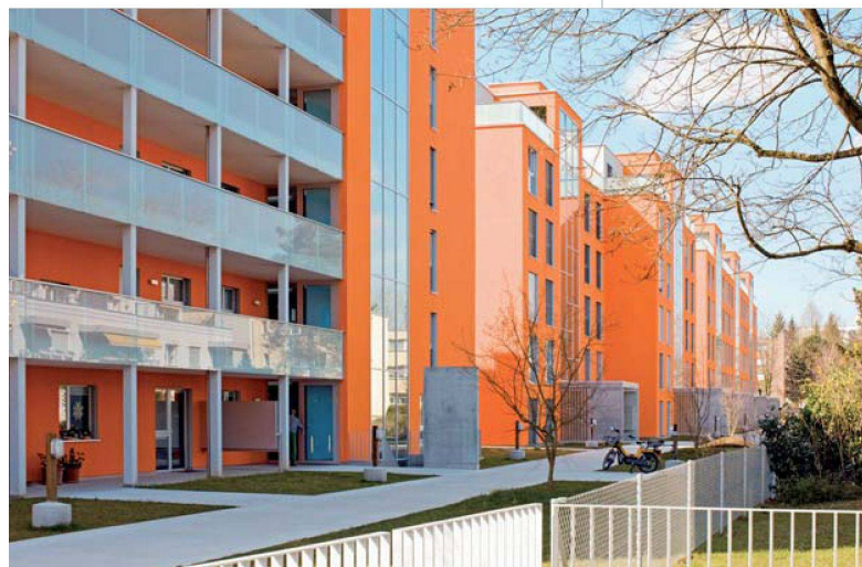
Blick auf die Eingangsseite der ersten Etappe.