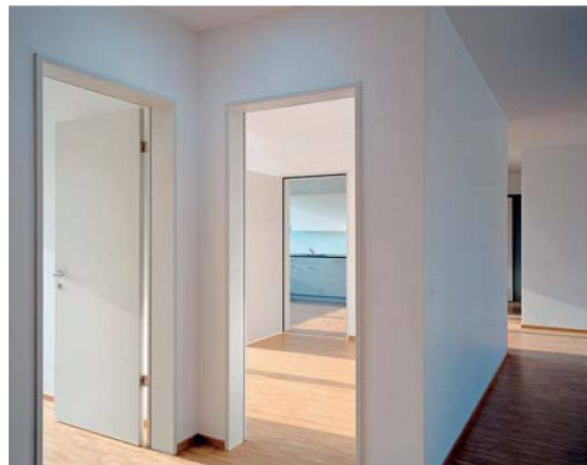
Dank Türen gegen Flur und Küche eröffnen sich für diesen Raum verschiedene Nutzungsmöglichkeiten.

te. Die Fenster sind Holz-Metall-Konstruktionen mit raumhoher Verglasung bei den Balkonen und Loggien. Markisen und Rafflamellenstoren dienen als Sonnen- und Sichtschutz.