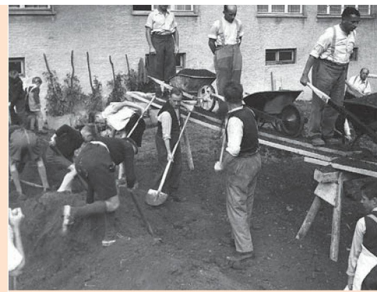
Mit anpacken war Ehrensache in der Genossenschaftssiedlung. Die Aufnahme stammt aus der «Anbauschlacht» während des Zweiten Weltkriegs.

Ich musste einiges einsacken, nicht nur von Frauen, auch von Männern. Alles, was bei mir nicht nach dem gewohnten Schema abgehalten wurde, forderte ihre Kritik heraus, die sie bei meinem Mann platzierten, und er übermittelte mir die Stimme des Volkes, was sehr lehrreich für mich war. Sachte bekam ich eine Ahnung davon, wie sehr