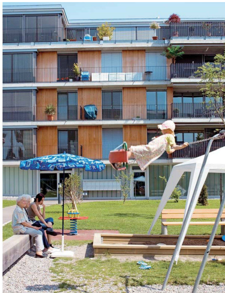
Genossenschaftlich wohnen einst und jetzt. Die Zeiten haben sich geändert, doch genossenschaftliche Werte wie Nachbarschaftlichkeit sind nach wie vor wichtig. Im Bild eine historische Aufnahme der Siedlung Burriweg (Baufreunde) sowie die 2004 erstellte Siedlung Steinacker (ASIG).

Genossenschaftlich wohnen – eine Philosophie?