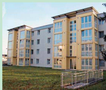
ASIG: Generelle Erhöhung um fünf Prozent auf den 1. Juli.