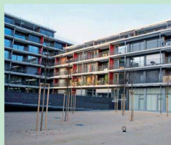
ABL: Dank günstiger Bankkonditionen vorläufig keine Erhöhungen.