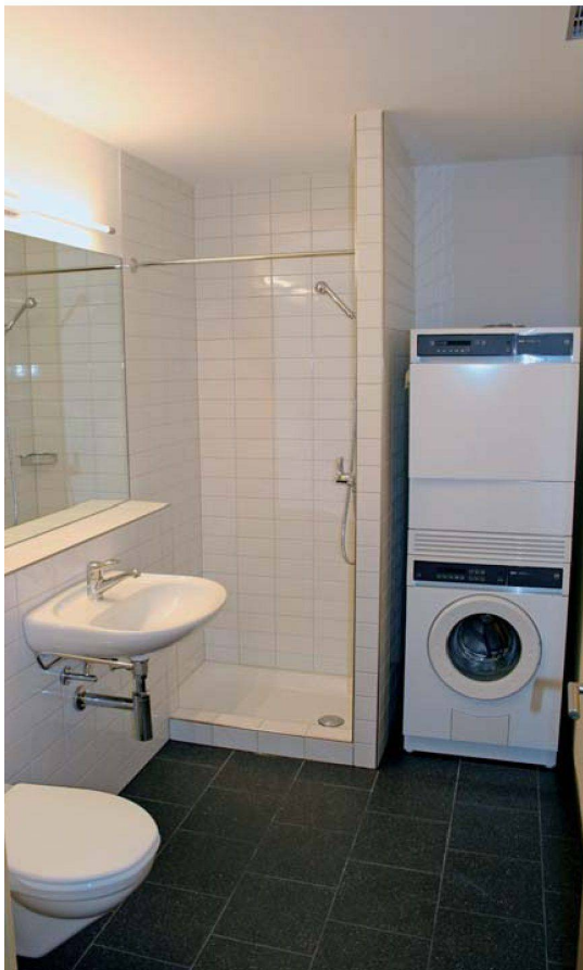
Der eigene Waschturm in der Wohnung gehört auch im genossenschaftlichen Wohnungsbau vielerorts bereits dazu: zum Beispiel bei der 2005 fertig gestellten Siedlung Am Tössufer der Heimstättengenossenschaft Winterthur.

Dürfen Mieter für fremde Personen waschen? Wer bezahlt die Reparatur der Waschmaschine? Darf der Mieter eine eigene Waschmaschine aufstellen? Lesen Sie alles über die rechtlichen Aspekte rund um die Waschküche auf Seite 41.