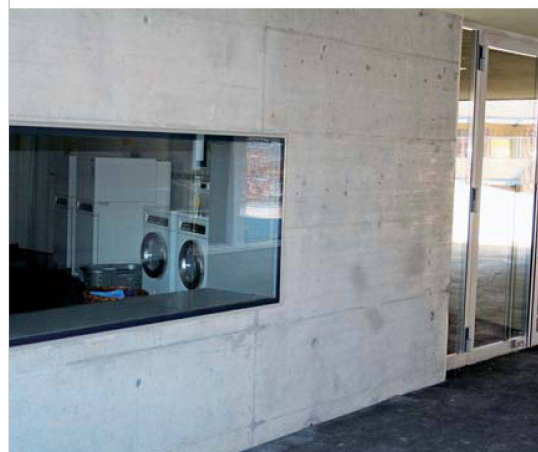
Sowohl im Ruggächern als auch im Wolfswinkel sind die Waschsaloons direkt neben den Hauseingängen angeordnet.