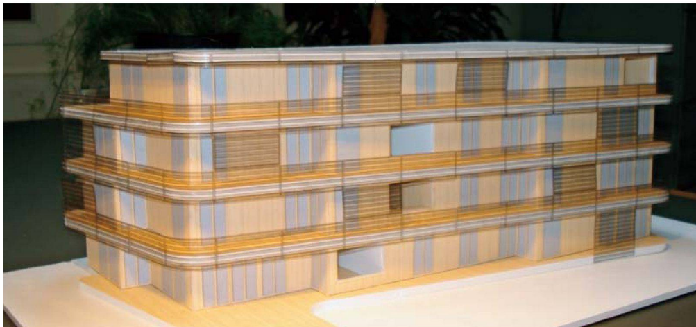
Haerle Hubacher entwarfen für die Alters-Hausgemeinschaft der Gesewo einen ökologisch vorbildlichen Holzbau.