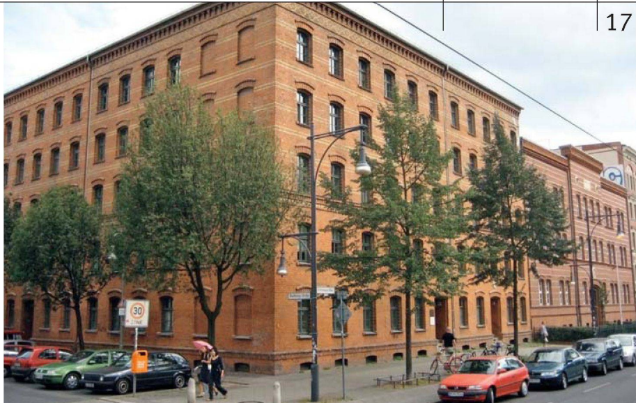
Auch so kann eine innovative Genossenschaftssiedlung aussehen: Die hundertjährige «Bremer Höhe» am Prenzlauer Berg in Berlin (zwischen Schönhauser Allee und Greifenhagener Strasse). Zu den Qualitäten der Blockrandüberbauung gehört, dass die Innenhöfe frei blieben und begrünt sind.

Planung und Durchführung von Altbaurenovationen und Neubauten Seestrasse 520 8038 Zürich Telefon 044 482 83 83