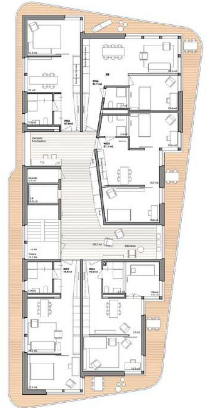
Die privaten Wohneinheiten sind um die Gemeinschaftsbereiche herum angeordnet, die auf alle Geschosse verteilt wurden. Damit werden Begegnungsmöglichkeiten geschaffen (Grundriss 1. OG).

Aufgrund der Ideen und Bedürfnisse der künftigen Bewohner schrieb die Gesewo im Juli 2007 einen Studienauftrag unter fünf Architekturbüros aus. Die Jury entschied sich für das Projekt des Zürcher Architekturbüros Haerle Hubacher, das zuletzt für die Wogeno in Zürich Schwamdingen die Siedlung Bockler entwarf. Es überzeugte mit einem viergeschossigen Holzbau, der den Standard Minergie-P-Eco erreichen soll. Die Materialwahl orientiert sich an einem gesunden Raumklima und der Systemtrennung im Hinblick auf den Rückbau. Die umlaufenden Balkone bieten privaten Aussenraum und verbinden gleichzeitig die Wohneinheiten miteinander. Auch die auf die Geschosse verteilten Gemeinschaftsbereiche und die darum herum angeordneten privaten Wohneinheiten kommen den Vorstellungen der Nutzer bezüglich Begegnungsmöglichkeiten entgegen.