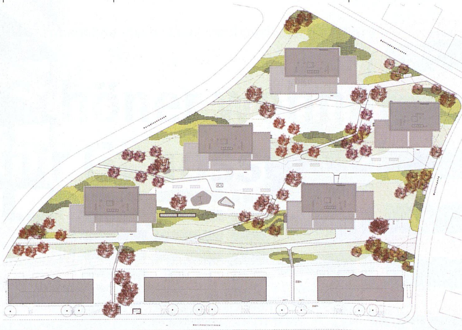
Situation der fünf neuen Baukörper der Siedlung Entlisberg 4. Im Vordergrund die belassenen Altbauten.

gliederten. In der Tat wirken die dreiteiligen Baukörper zwischen den Altbauten nicht übermässig wuchtig und offenbaren ihr Volumen erst im Inneren. Dank der versetzten Anordnung entsteht kein versperrtes Gesamtbild, und ein Durchblick ist von allen Seiten möglich.