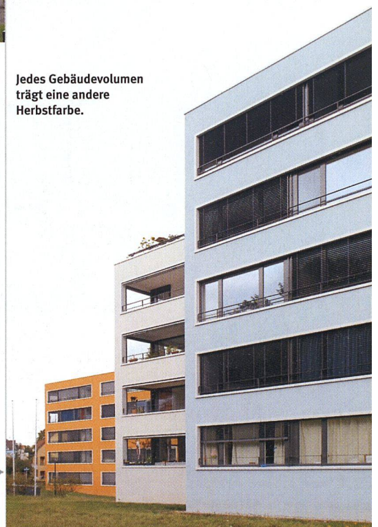
Jedes Gebäudevolumen trägt eine andere Herbstfarbe.

RUHIG WOHNEN DANK AUTOBAHNÜBERDECKUNG. Wer zu Fuss von der stark befahrenen Albisstrasse Richtung Entlisbergquartier einbiegt, nimmt vor allem die zunehmende Ruhe wahr. Das war nicht immer so. Die nahe A3 sorgte während Jahren für konstanten Lärm, bis mit der 2002 vollendeten Autobahnüberdeckung ruhigere Zeiten einsetzen – mit deren Planung hatte auch das Ersatzneubauprojekt neuen Schwung erhalten. Die