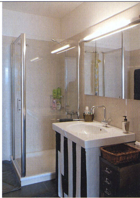
Blick ins Bad mit dem in der Wand integrierten Spiegelschrank.