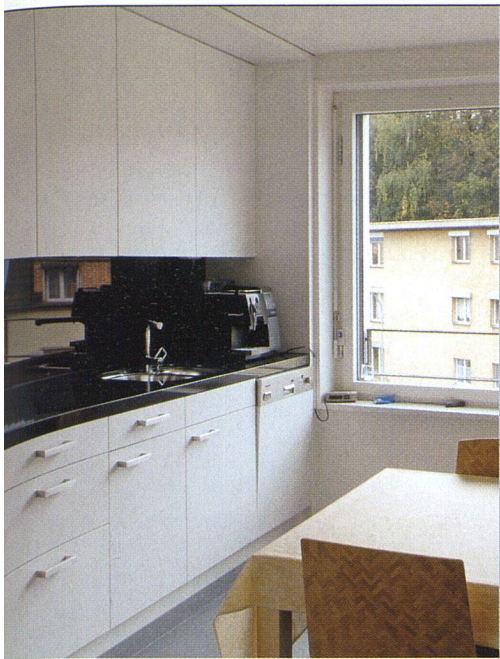
Diese 4½-Zimmer-Wohnung verfügt über eine abgeschlossene Wohnküche.