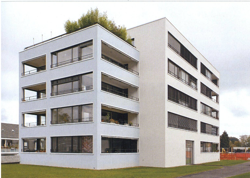
Die grosszügigen privaten Aussenräume prägen das Bild.

sacht und deshalb ausgesprochen umweltfreundlich arbeitet. Noch einen Schritt weiter kann gehen, wer die Herkunft des Stroms für die Wärmepumpe selber bestimmt und mit dem lokalen Elektrizitätswerk einen entsprechenden Vertrag abschliesst.