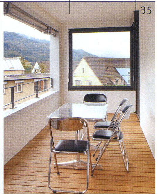
Loggien sind länger nutzbar als Balkone. Im Entlisberg ist zusätzlich eine Seite verglast.