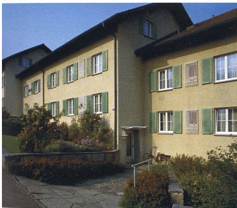
Bei der Renovation dieser typischen Genossenschaftssiedlung entschied sich die Bauherrschaft für Kunststofffenster.

rend der kritischen vier Wochen sind für 2003 zwölf Hitzetage – in anderen Jahren deren fünf – dokumentiert. Im Innenraum steigt das Thermometer während 22 Tagen über 26,5 °C; sonst sind es nur sieben Tage. Die erhöhte Belastung eines Raumes durch externe Energieeinträge macht den ohnehin notwendigen Sonnenschutz noch wichtiger – ganz besonders an Gebäuden mit hohem Glasanteil in den Fassaden. Übrigens: Fensterkonstruktionen mit hohem Wärmeschutz beeinflussen im Sommer das Raumklima positiv. Denn neben dem Strahlungseintrag wirkt sich die Wärmeleitung durch das Fenster negativ aus.