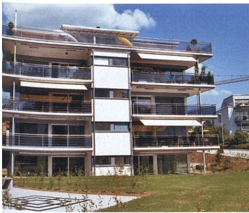
Grosse Fensterflächen sind im Trend: Genossenschaftliches Mehrfamilienhaus in Uetikon am See (ZH) mit Kunststofffenstern.