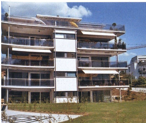
Grosse Fensterflächen sind im Trend: Genossenschaftliches Mehrfamilienhaus in Uetikon am See (ZH) mit Kunststofffenstern.