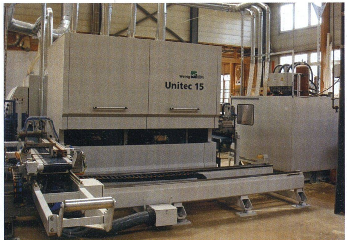
Holzbearbeitung im Werk von 1a hunkeler in Kriens.