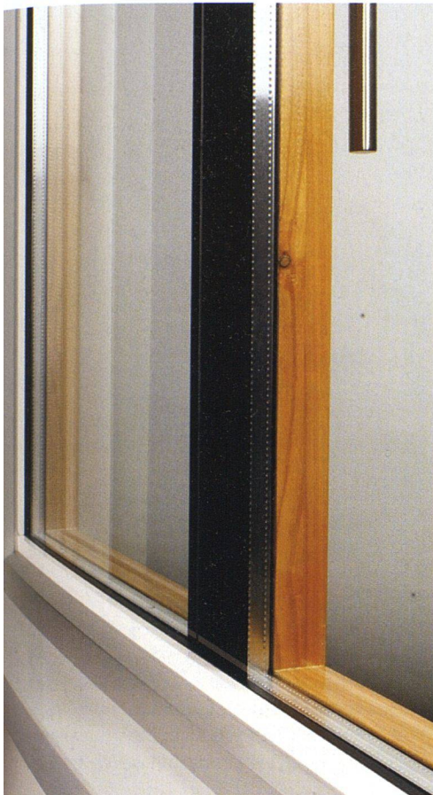
Die Fensterbauer erfüllen die unterschiedlichsten Wünsche. Im Bild eine Ganzglasausführung mit naturlackiertem Holz auf der Innenseite.