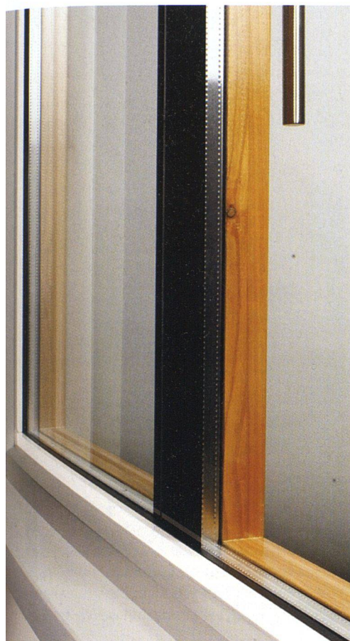
Die Fensterbauer erfüllen die unterschiedlichsten Wünsche. Im Bild eine Ganzglasausführung mit naturlackiertem Holz auf der Innenseite.

fenster 52 Prozent und beim Holz-Metall-Fenster gar 56 Prozent.