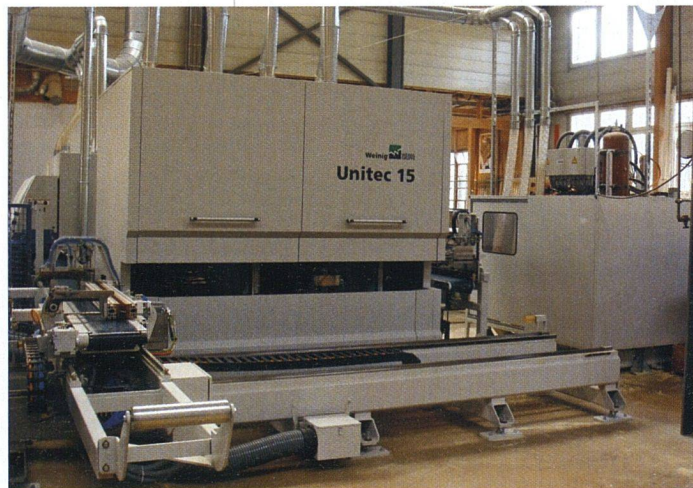
Foto: sa hunkeler Holzbearbeitung im Werk von 1a hunkeler in Kriens.