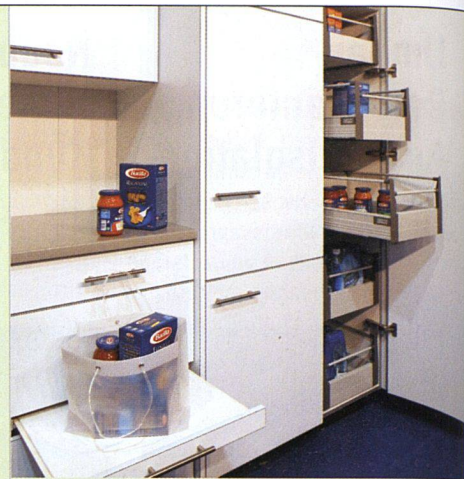
Sanitas Troesch AG 3018 Bern Telefon 031 998 81 11 www.sanitastroesch.ch

Der Schweizer Küchenbauer Sanitas Troesch schreibt der Arbeitsplatzergonomie besondere Bedeutung zu. «Die Küche ohne Handicaps» richtet sich nicht nur an Senioren, sondern an alle Bauherren, die vorausschauend planen. Heute steht eine breite Palette von Elementen zur Verfügung, die die Arbeit in der Küche wesentlich erleichtern. Die Spezialküche für Benutzer mit Einschränkungen gibt es aber nicht. Die Bedürfnisse sind zu unterschiedlich. Darum setzt Sanitas Troesch mit ihren Angeboten auf diverse Anpassungsoptionen. Alle Grundsätze und Planungsdetails wurden mit einem Fachberater für altersgerechtes Bauen erarbeitet und zusammengestellt.