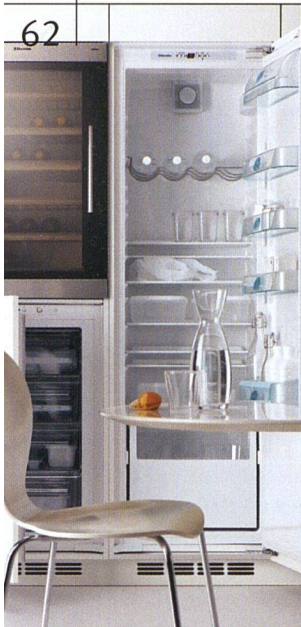
Electrolux AG 8048 Zürich Telefon 044 405 81 11 www.electrolux.ch