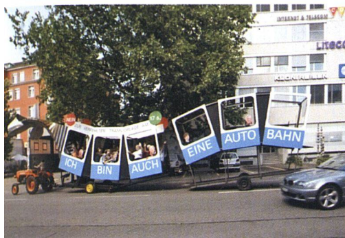
Die neue Tramlinie in Zürich West ist mit einem Ausbau des Strassenverkehrs verbunden. Dagegen wehren sich die Genossenschaften.

Bau- und Wohngenossenschaft KraftWerks, Zürich