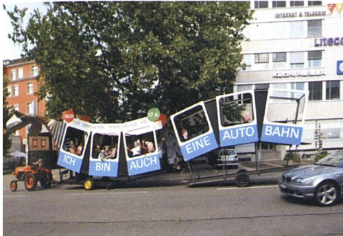
Die neue Tramlinie in Zürich West ist mit einem Ausbau des Strassenverkehrs verbunden. Dagegen wehren sich die Genossenschaften.

Bau- und Wohngenossenschaft KraftWerks, Zürich