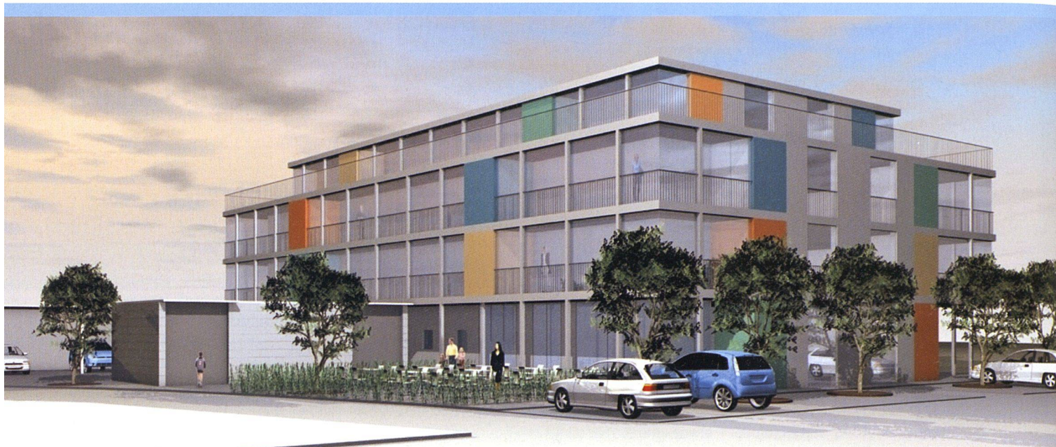
Die Genossenschaft Alterswohnungen Näfels expandiert nach Oberurnen. Im Neubau an zentraler Lage entstehen 24 Einheiten und eine öffentliche Cafeteria.