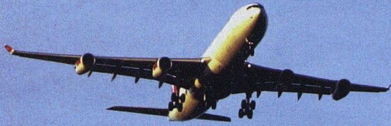
Südanflug auf den Flughafen Zürich: Eine Airbus A340 morgens um 6 Uhr über Zürich Schwamendingen.

mendingen zeichnet das Südanflug-Monitoring von Statistik Stadt Zürich (2006) indessen ein etwas anderes Bild. Danach ziehen seit drei Jahren Schweizer Familien weg, während ausländische zuziehen. Die Baugenossenschaft Vitasana hatte unmittelbar nach Einführung des Südanflugs Mieterwegzüge verzeichnet; heute gebe es hingegen kaum mehr Wechsel als an anderen Orten. Die Vitasana hat rund 350 Wohnungen in der Schneise. Viele ältere Leute wohnen hier. «Mit den na-