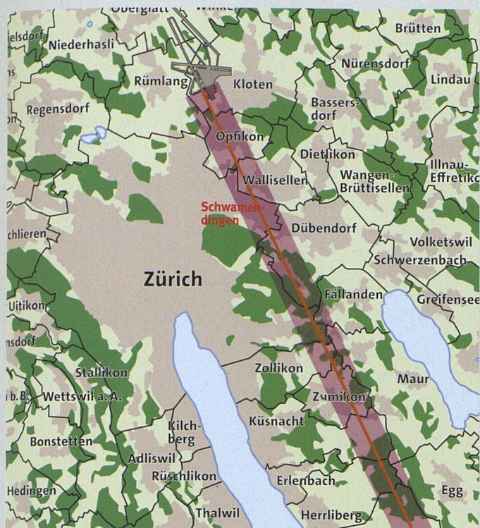
Die Südanflugschneise führt über einen Teil des Zürcher Stadtteils Schwamendingen. Im am meisten betroffenen Quartier Hirzenbach besitzen die Baugenossenschaften rund vierzig Prozent der Wohnungen.