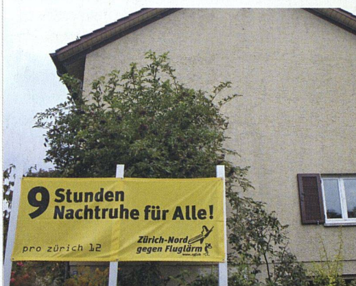
Die Schwamendinger Genossenschaften setzen sich in der Vereinigung «pro zürich12» für die Nachtruhe ihrer Mieter ein.