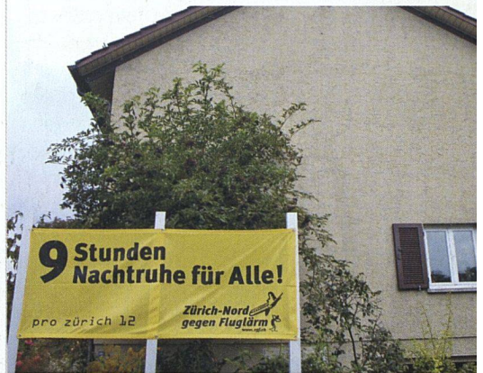
Die Schwamendinger Genossenschaften setzen sich in der Vereinigung «pro zürich12» für die Nachtruhe ihrer Mieter ein.