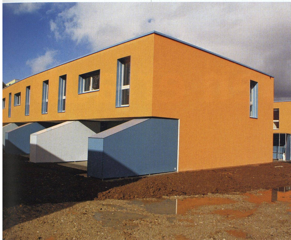
Für die Schwamendinger Baugenossenschaften ist der Fluglärm mit ein Grund, Altbauten zu ersetzen. Die Neubausiedlungen wappnen sich mit Schallschutzfenstern und kontrollierter Lüftung gegen die Immissionen (im Bild die Siedlungen Kronwiesen der Vitasana (oben) und Luegisland der Genossenschaft der Baufreunde).

Die ASIG setzt sich im Sinne ihrer Mitglieder für eine gute Wohnqualität ein. Die Flughafen-Initiative ist gegenwärtig das einzige Mittel, mit dem sich die Öffentlichkeit wieder an der Diskussion beteiligen kann. Dabei geht es nicht um die Abschaffung des Flughafens mit seinen Arbeitsplätzen – aber um eine gleichwertige Behandlung ökologischer und sozialer Aspekte.