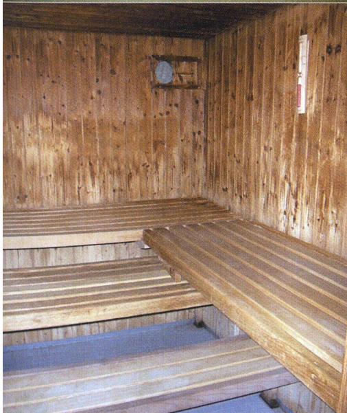
Wellnessangebote wie Sauna, Fitnessraum oder ein extragrosses Gemeinschaftsbad finden sich vor allem in speziellen Hausgemeinschaften für die ältere Generation – vielleicht ein künftiger Trend?