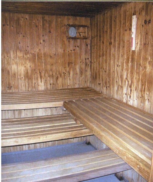
Wellnessangebote wie Sauna, Fitnessraum oder ein extragrosses Gemeinschaftsbad finden sich vor allem in speziellen Hausgemeinschaften für die ältere Generation – vielleicht ein künftiger Trend?