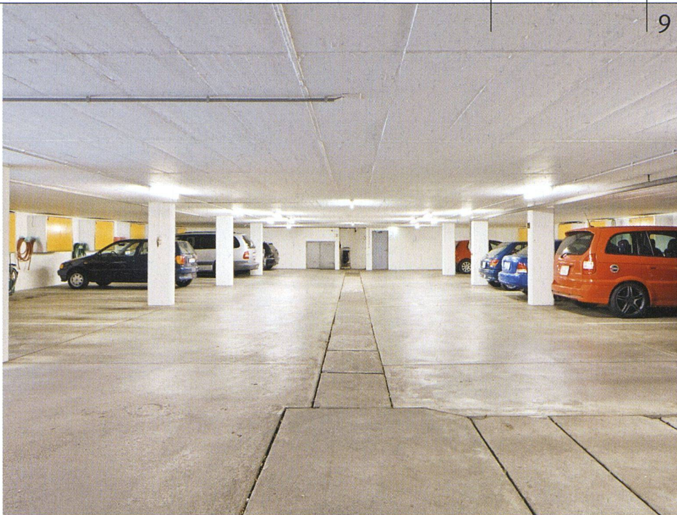
In der Siedlung Hirzenbach hat die ASIG die Qualität mit geringem Aufwand stark verbessert: Zwischen der sanierten und der alten (unten) Tiefgarage liegen Welten.