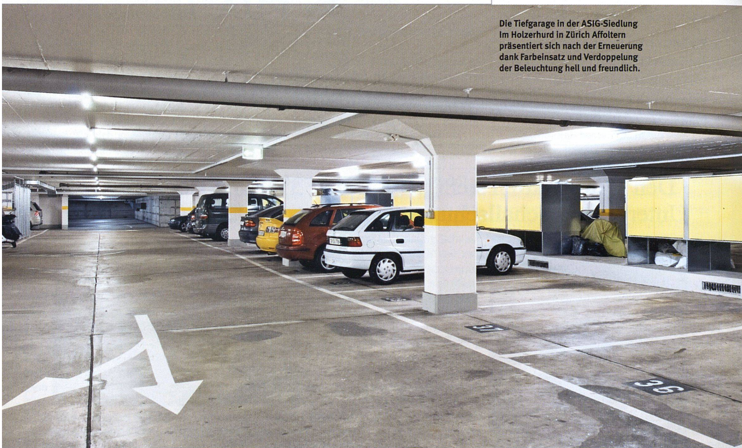
Die Tiefgarage in der ASIG-Siedlung Im Holzerhud in Zürich Affoltern präsentiert sich nach der Erneuerung dank Farbeinsatz und Verdoppelung der Beleuchtung hell und freundlich.

VON STEFAN HARTMANN ■ Tiefgaragen sind unwirtliche Orte – düster, prekär beleuchtet, benzingeschwängerte Luft. Es hallt unheimlich, wenn in der Ferne dumpf das Eingangstor schliesst oder irgendwo Schritte nahen. Kurz: Orte zum Fürchten. Und trotzdem müssen sich viele Siedlungsbewohner dort zweimal oder noch öfter täglich aufhalten. Reflexartig strebt man dem Ausgang zu – wenn man ihn denn findet. Denn Markierungen sind meist kaum vorhanden. «In vielen Wohnsiedlungen be-