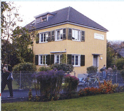
An der Bieler Führung erfuhren die Teilnehmenden, wie die Biwog mit ihren alten Liegenschaften umgeht.

Das Sanieren denkmalgeschützter Bauten bereitet vielen Genossenschaften Kopfzerbrechen. Oft lassen sich die alten Wohnungen nur schwer den heutigen Bedürfnissen anpassen oder die Sanierung wird rasch sehr teuer. Die Bieler Genossenschaft Biwog wählte für die vom bekannten Architekten Eduard Lanz entworfene Siedlung Linde einen Mittelweg. Sie orientiert sich am Konzept der Nachhaltigkeit. Die Biwog greift dabei zum Teil zurück auf alte Baumethoden und Originalmaterialien;