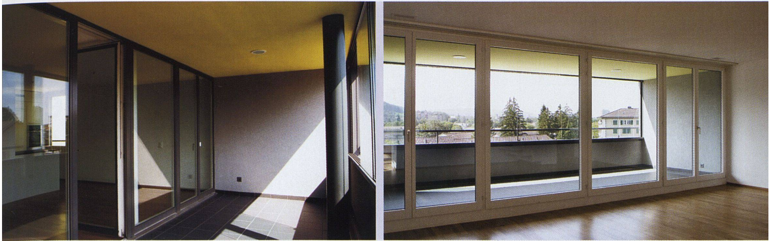
Grosszügige private Aussenräume.

gemacht werden können. Aber ausser den zeittypischen beengten Grundrissen war vor allem die Bausubstanz zu schlecht. Eine Sanierung hätte sich nicht gelohnt. Die Genossenschaft hatte bereits beide Modelle – Sanierung und Ersatzneubau – an einem anderen Standort ausprobiert. Dort hatte sie die Erfahrung gemacht, dass sich der Ersatzneubau auf jeden Fall besser bewährt. In Schwamendingen entstanden durch den Neubau zwar nicht mehr Wohnungen, dafür aber viel