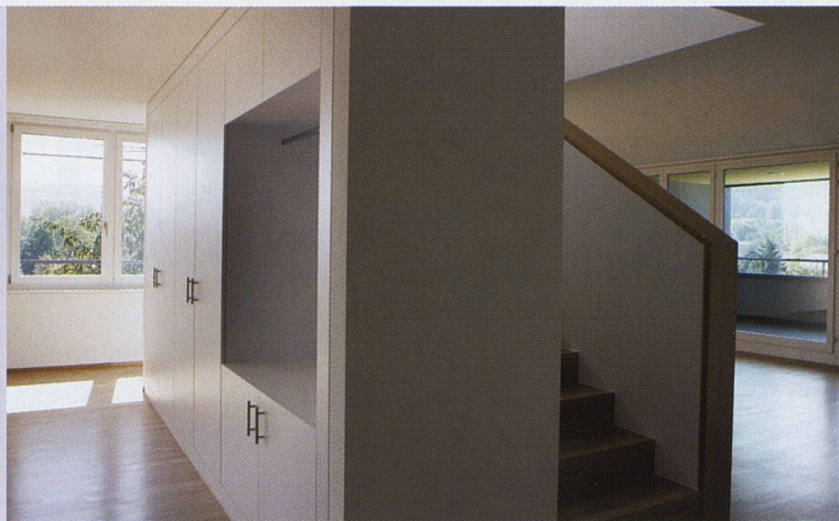
Spannende Wohnungsgrundrisse, hochwertige Materialien.