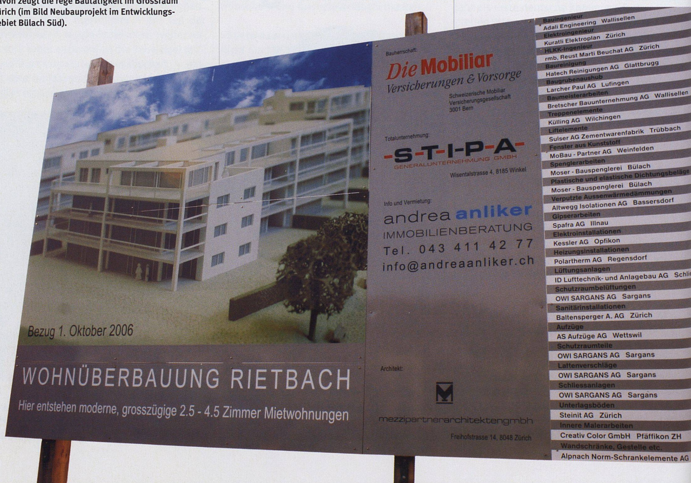
Mietwohnungen sind bei Investoren im Trend. Davon zeugt die rege Bautätigkeit im Grossraum Zürich (im Bild Neubauprojekt im Entwicklungsgebiet Bülach Süd).

nischen REITs (Real Estate Investment Trusts) betrug die Börsenkapitalisierung 1994 noch 40 Milliarden Franken. Heute hat sie die Summe von 350 Milliarden Franken überschritten. Als jüngster Markt haben sich im Laufe der letzten Jahre auch die europäischen börsenkotierten Immobiliengesellschaften mit einer Marktkapitalisierung von etwa 125 Milliarden Franken etabliert (Stand Mitte 2004). In