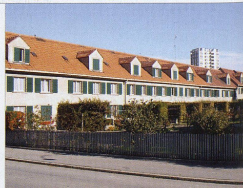
Die Ein- und Zweifamilienhäuser aus dem Jahr 1918 konnten der lärmigen Ringstrasse nicht mehr trotzen.

TRAGBARE MIETEN. Die Mieten hätten in beiden Fällen angehoben werden müssen. «Der springende Punkt», so Graf, «war die Tatsache, dass die Mietzinse mit einer Sanierung