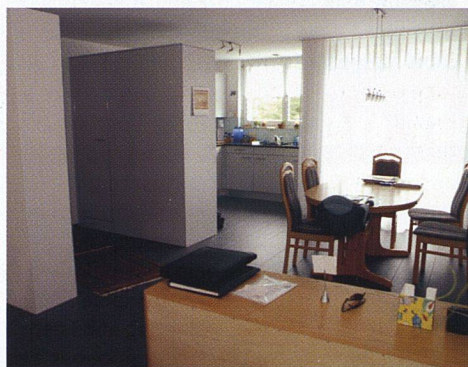
Im Neubau hat sich die Wohnfläche gegenüber vorher praktisch verdoppelt. Die grosszügigen Wohnungen sind vor allem bei Familien beliebt.