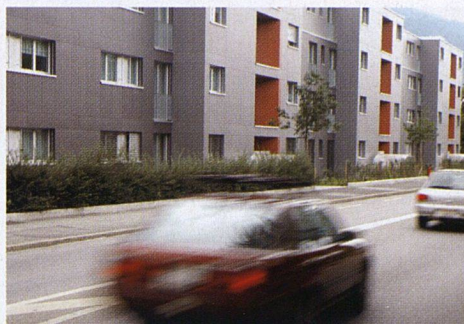
Die Lärmsituation an der stark befahrenen Ringstrasse verlangte eine gute Isolierung und eine mechanische Lüftung. Damit war bereits der Weg für den Minergie-Standard vorgegeben.

UMDENKEN BEI HANDWERKERN. Ein Knackpunkt bei der neuen Bauweise waren die Handwerker. «Es war nicht ganz einfach, «Label-kompatible» Unternehmer zu finden», klagt Graf. Den Handwerkern fehlen zum Teil noch die Kenntnisse in moderner Bauökologie, etwa über Alternativen zur Vermeidung von Lösemitteln in Baustoffen. So verlangte der Architekt, dass zum Beispiel bei den Keramikplatten lösemittelfreie Kleber verwendet wurden. Bei den Farben kamen mineralische statt Kunstharzfarben zum Einsatz. Parkette