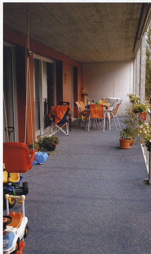
Die grosszügigen Loggien und Balkone sind zusätzliche Wohnausseräume.