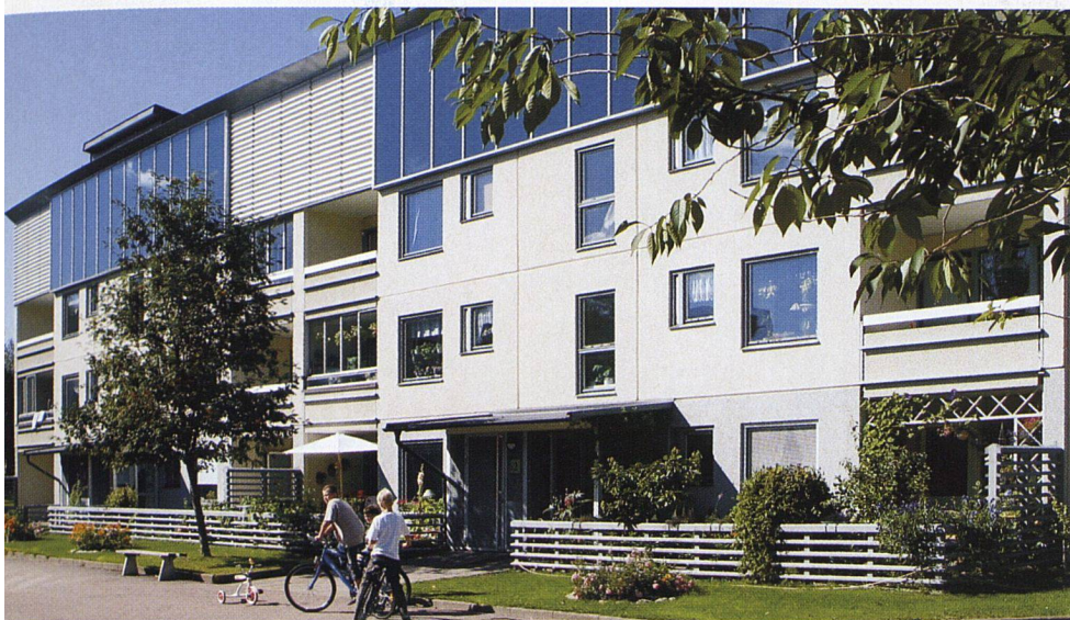
«Ein Experiment»: Das Einzelgebäude, das das ganze Ensemble gegen Norden abschliesst, ist mit Solarkollektoren an der Südfassade und einer doppelten Gebäudehülle ausgerüstet.

Prozent weniger als zuvor. Und das, obwohl heute alle Wohnungen vermietet sind. Dank der tieferen Betriebskosten hat sich die Wohnungsmiete für die meisten Bewohner kaum erhöht – für eine Vierzimmerwohnung zum Beispiel um lediglich 85 Franken pro Monat. Als absolutes Novum in Schweden werden Warm- und Kaltwasser, Heizungs- und Stromverbrauch in Gärdssten neu individuell pro Wohnung abgerechnet, wobei jeweils ein Basisbetrag im Mietpreis enthalten ist. Bei der Heizung bedeutet dies zum Beispiel eine Raumtemperatur von 21 Grad. Wer es gerne wärmer hat, bezahlt mehr, wer den Thermostat auf eine tiefere Temperatur stellt, wird mit einer günstigeren Miete belohnt. Dadurch werden unterdessen pro Wohnung jährlich über 800 Franken eingespart.