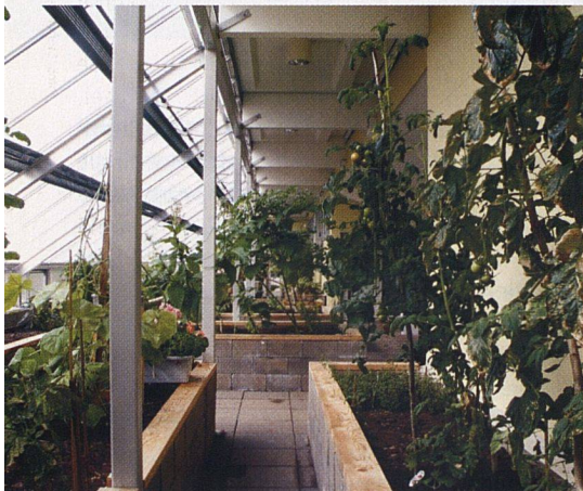
Die Gewächshäuser sind Anschauungsbeispiel für Solarenergie und Treffpunkt in einem.

Da die defekte Gebäudehülle ohnehin ausgebessert werden musste, versah man sie gleich mit einer besseren Isolation. Die Fassaden erhielten eine 80 Millimeter dicke Mineralwoll-Dämmung, die Dächer eine 120-Millimeter-Isolation und eine Gummischicht als Wetterschutz. Ihren Namen verdanken die