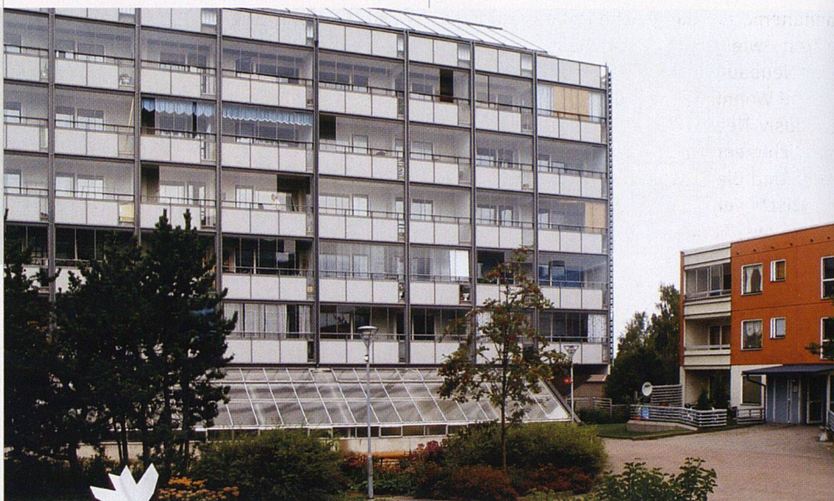
Das neue Wahrzeichen von Gärdsten: Die «Solarhäuser» mit den Sonnenkollektoren und verglasten Fassaden.