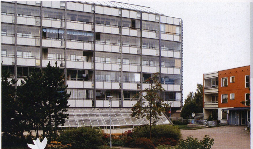
Das neue Wahrzeichen von Gärdsten: Die «Solarhäuser» mit den Sonnenkollektoren und verglasten Fassaden.