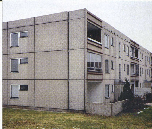
Hier wohnte nur, wer keine andere Wahl hatte: Gärdssten vor der Renovation