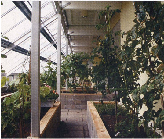
Die Gewächshäuser sind Anschauungsbeispiel für Solarenergie und Treffpunkt in einem.

Da die defekte Gebäudehülle ohnehin ausgebessert werden musste, versah man sie gleich mit einer besseren Isolation. Die Fassaden erhielten eine 80 Millimeter dicke Mineralwoll-Dämmung, die Dächer eine 120-Millimeter-Isolation und eine Gummischicht als Wetterschutz. Ihren Namen verdanken die