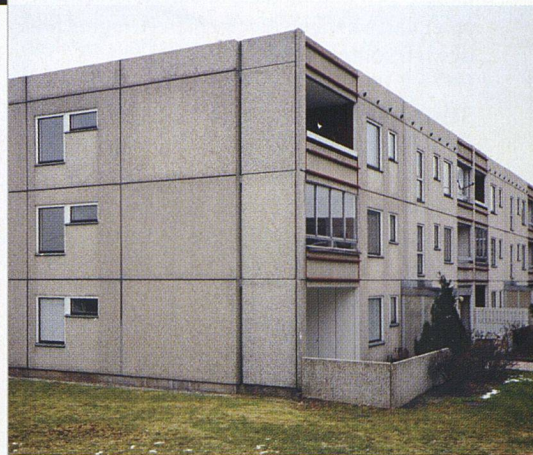
Hier wohnte nur, wer keine andere Wahl hatte: Gärdsten vor der Renovation